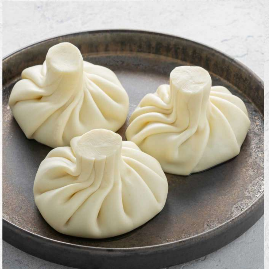
ХИНКАЛИ свинина/говядина баранина