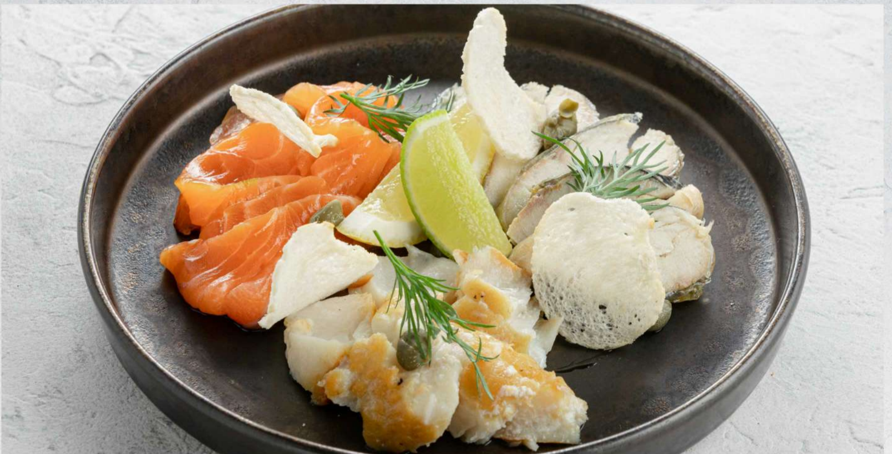
РЫБНОЕ АССОРТИ (форель с/с, треска г/к, рулет из скумбрии г/к) *