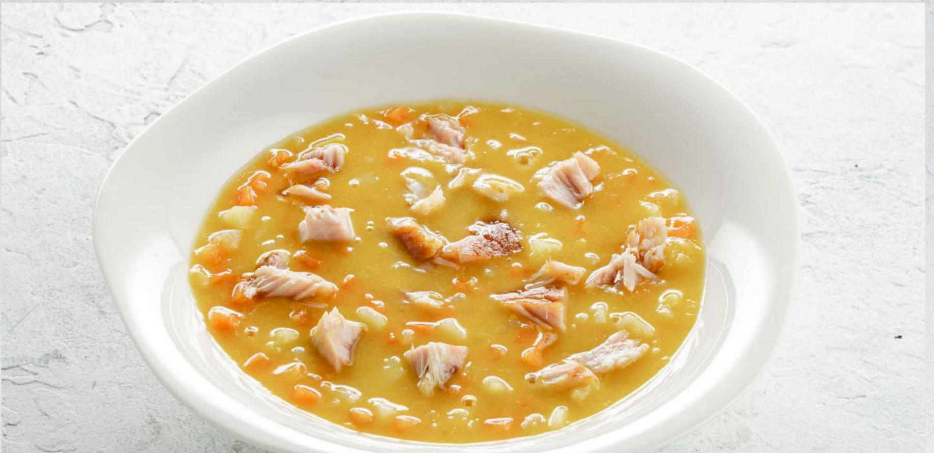
ГОРОХОВЫЙ СУП С КОПЧЕНОСТЯМИ