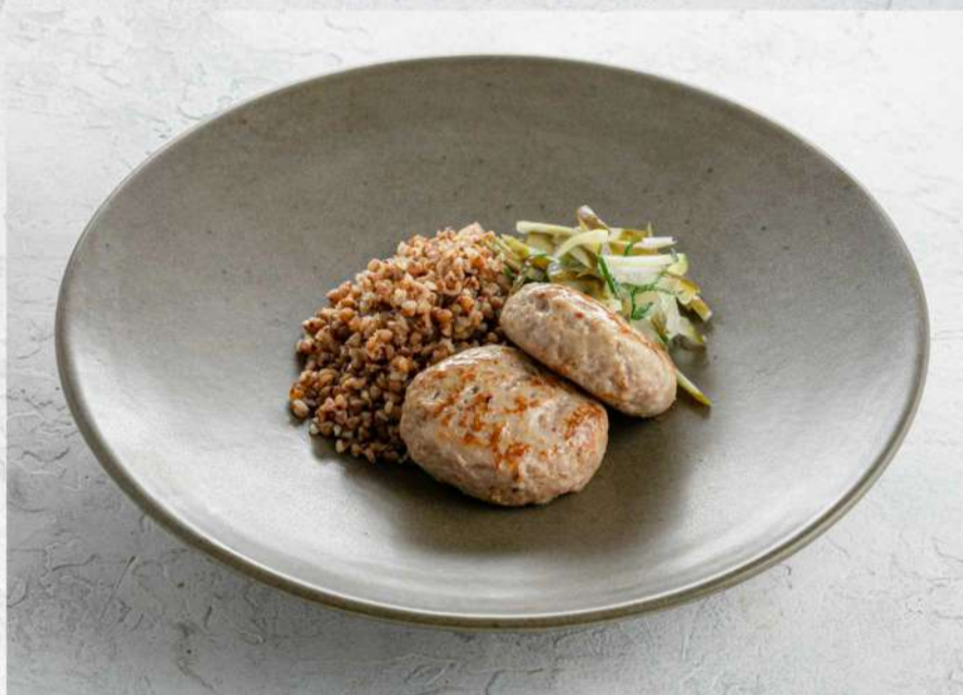
ДОМАШНИЕ КОТЛЕТЫ С ГРЕЧЕЙ