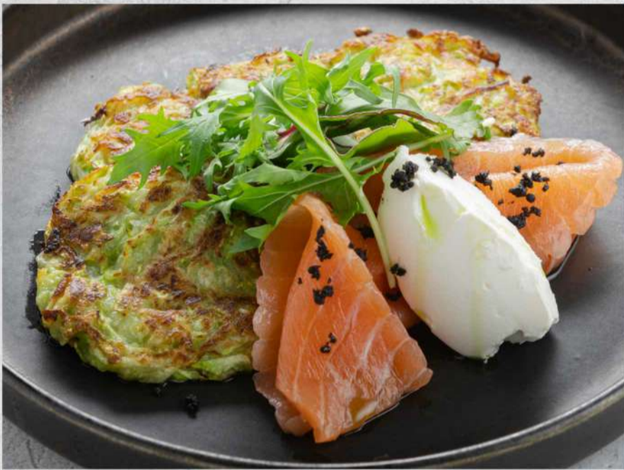
ОЛАДУШКИ ИЗ КАБАЧКА* С ФОРЕЛЬЮ СЛАБОЙ СОЛИ