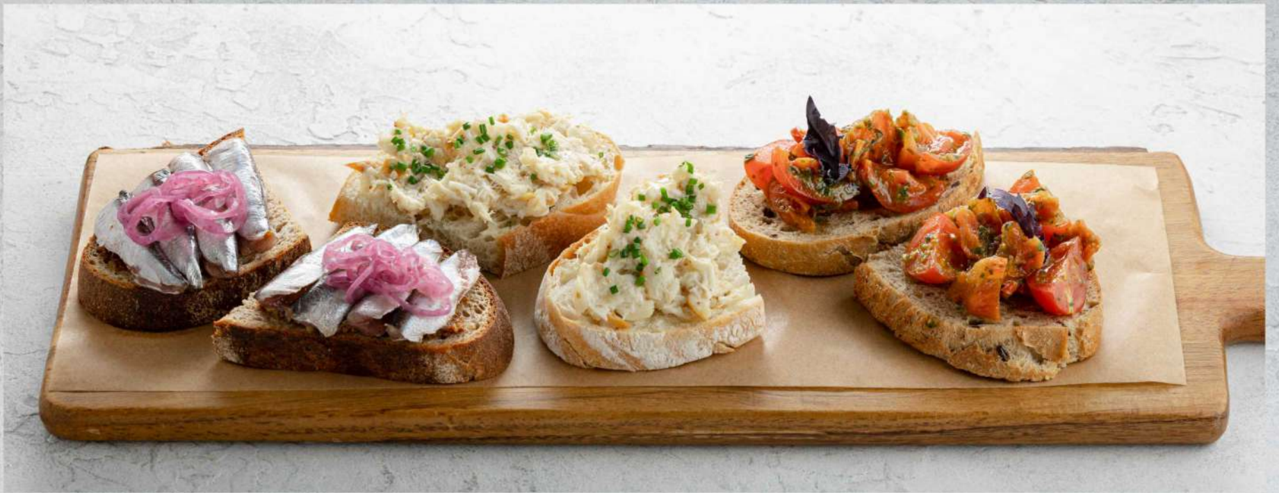
БРУСКЕТТА С КИЛЬКОЙ 380₽