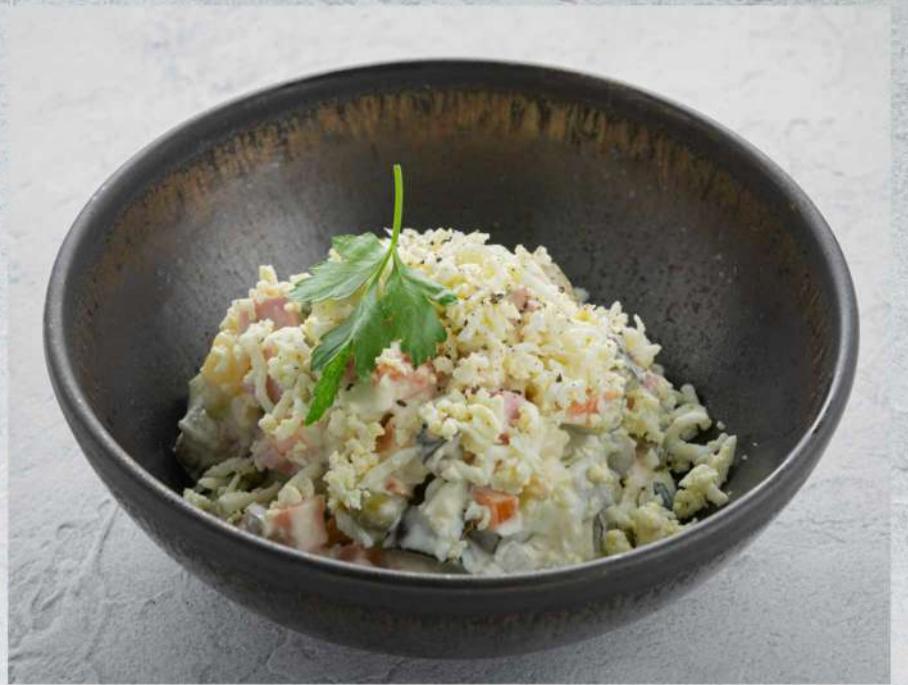
ОЛИВЬЕ С КОЛБАСОЙ