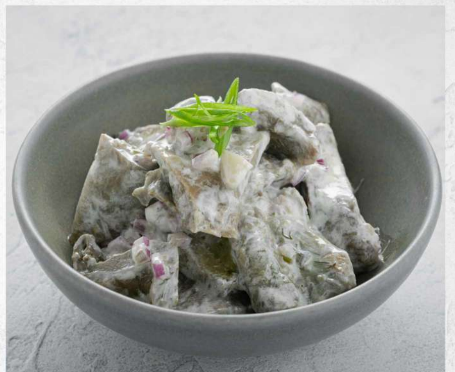
БЕЛЫЕ ГРУЗДИ СО СМЕТАНОЙ*