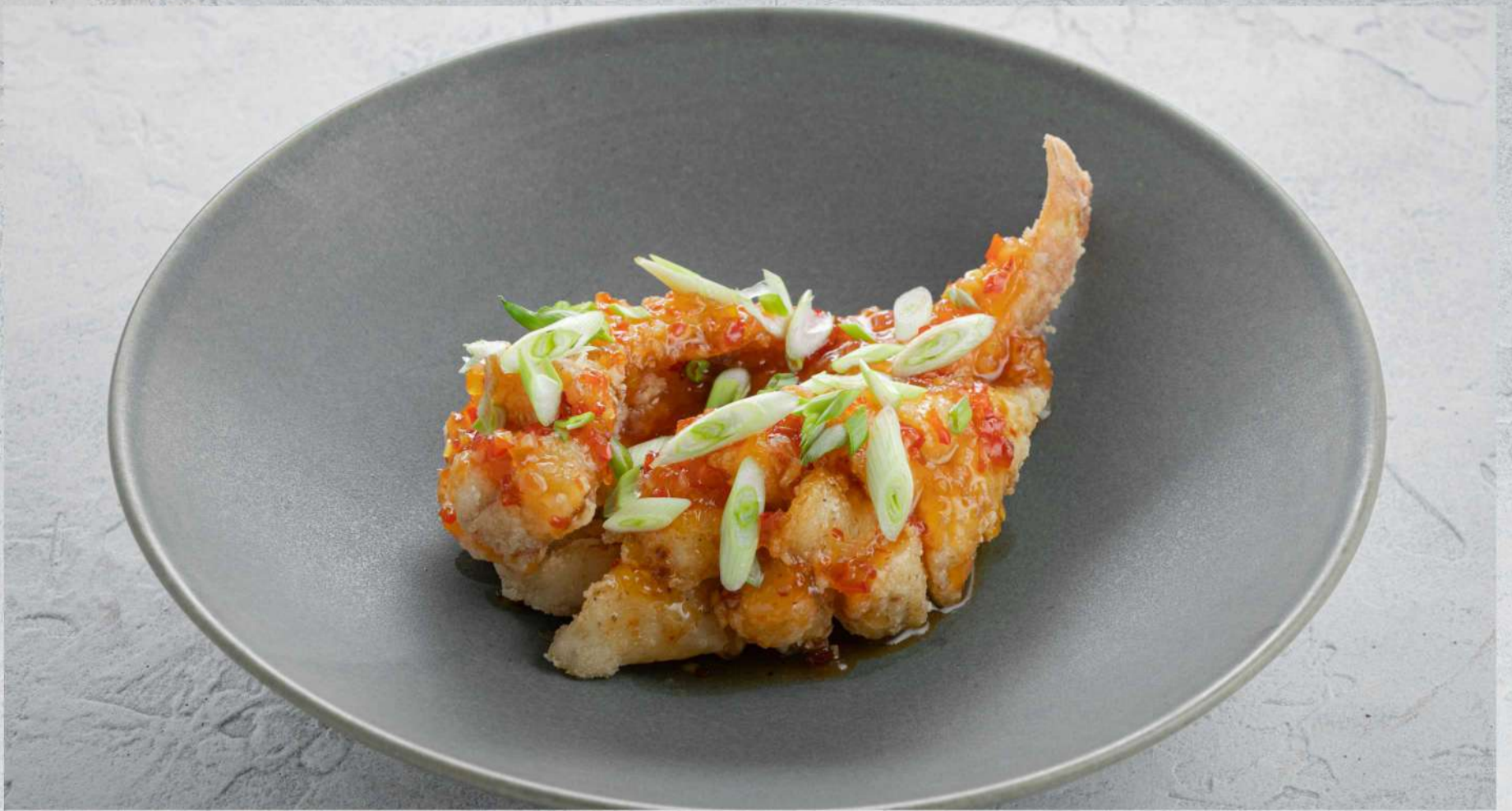
ОКУНЬ В КИСЛО-СЛАДКОМ СОУСЕ