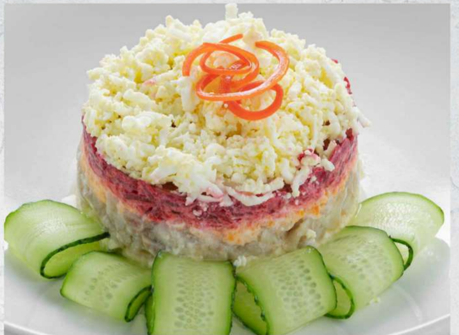
СЕЛЕДКА ПОД ШУБОЙ