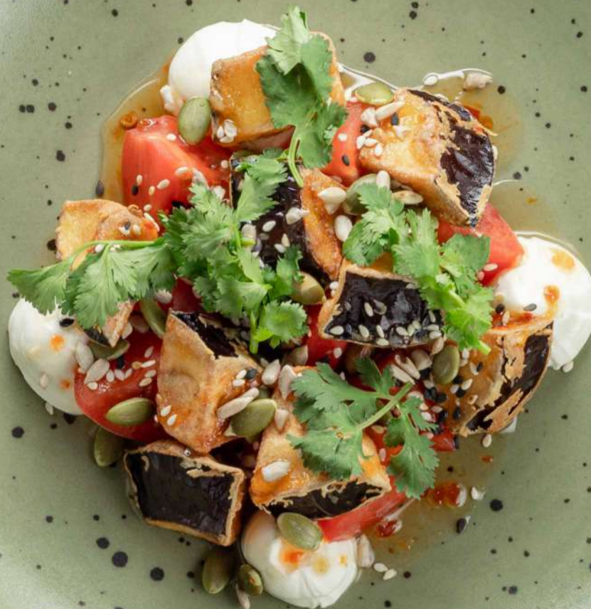
САЛАТ С ХРУСТЯЩИМИ БАКЛАЖАНАМИ И СЛИВОЧНЫМ СЫРОМ 690₹