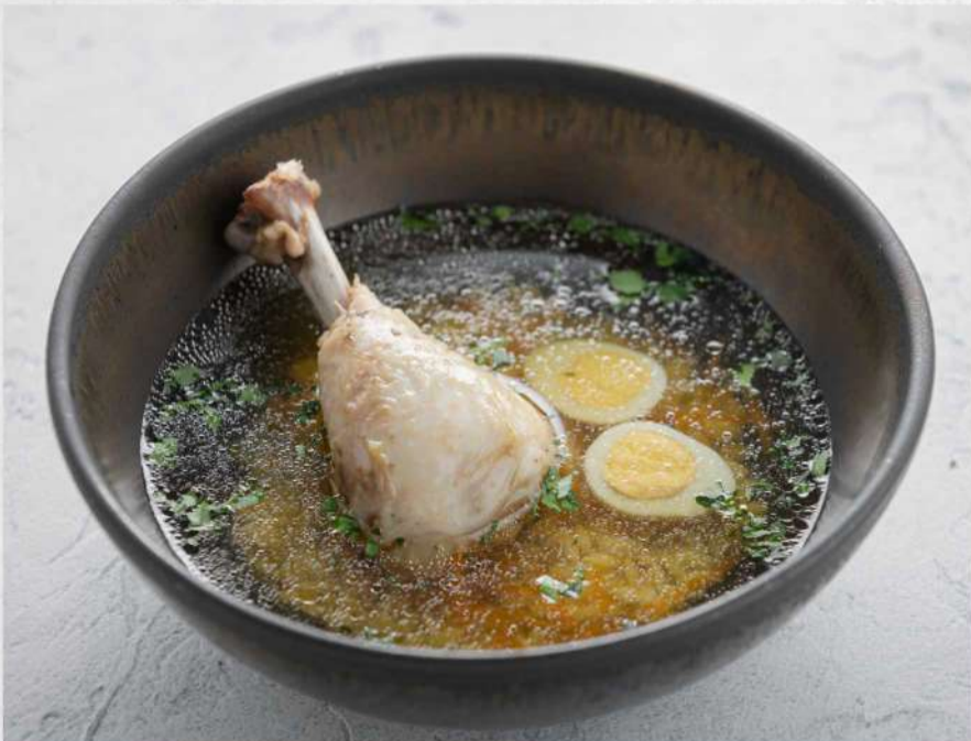
КУРИНЫЙ СУП С ОРЗО