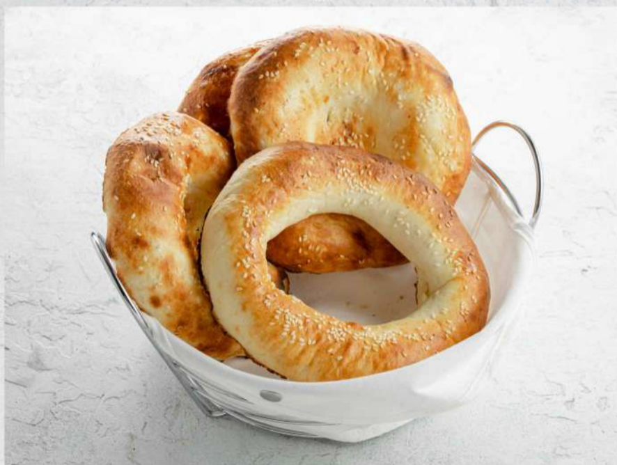
ЛЕПЕШКА ИЗ ТАНДЫРА С СЫРОМ ЛЕПЕШКА ИЗ ТАНДЫРА