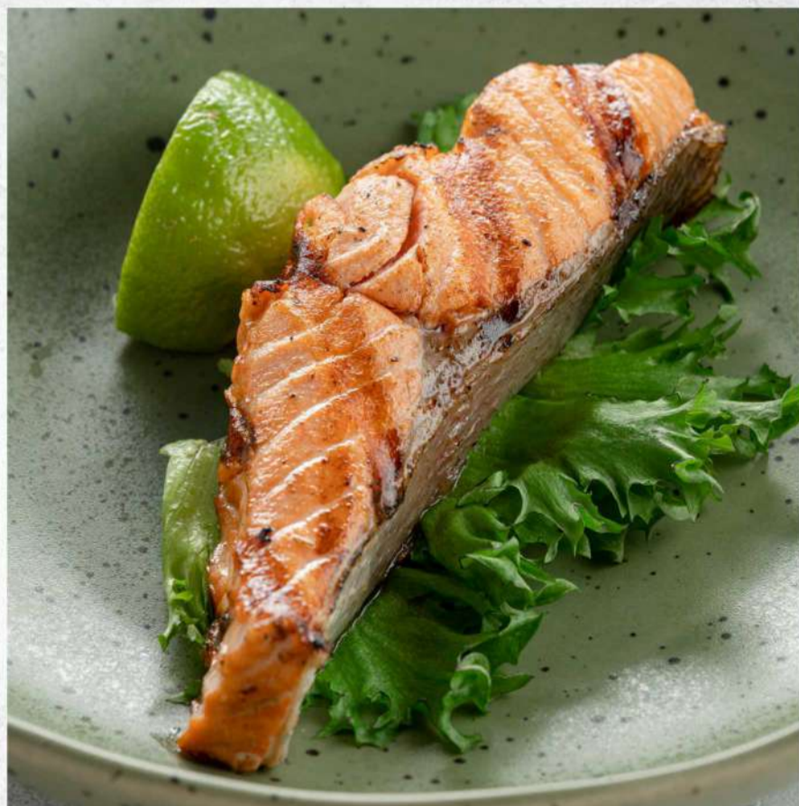
СТЕЙК ФОРЕЛИ НА ГРИЛЕ*