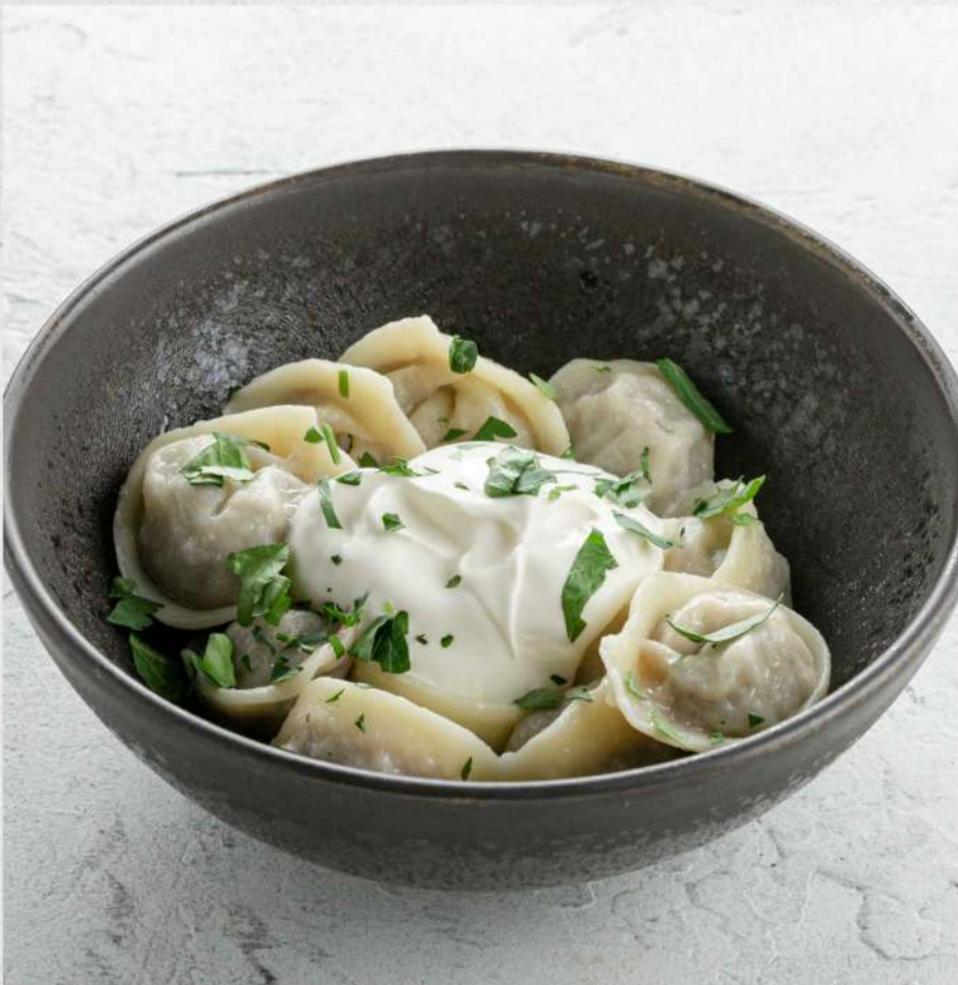
ДОМАШНИЕ ПЕЛЬМЕНИ с бульоном без бульона