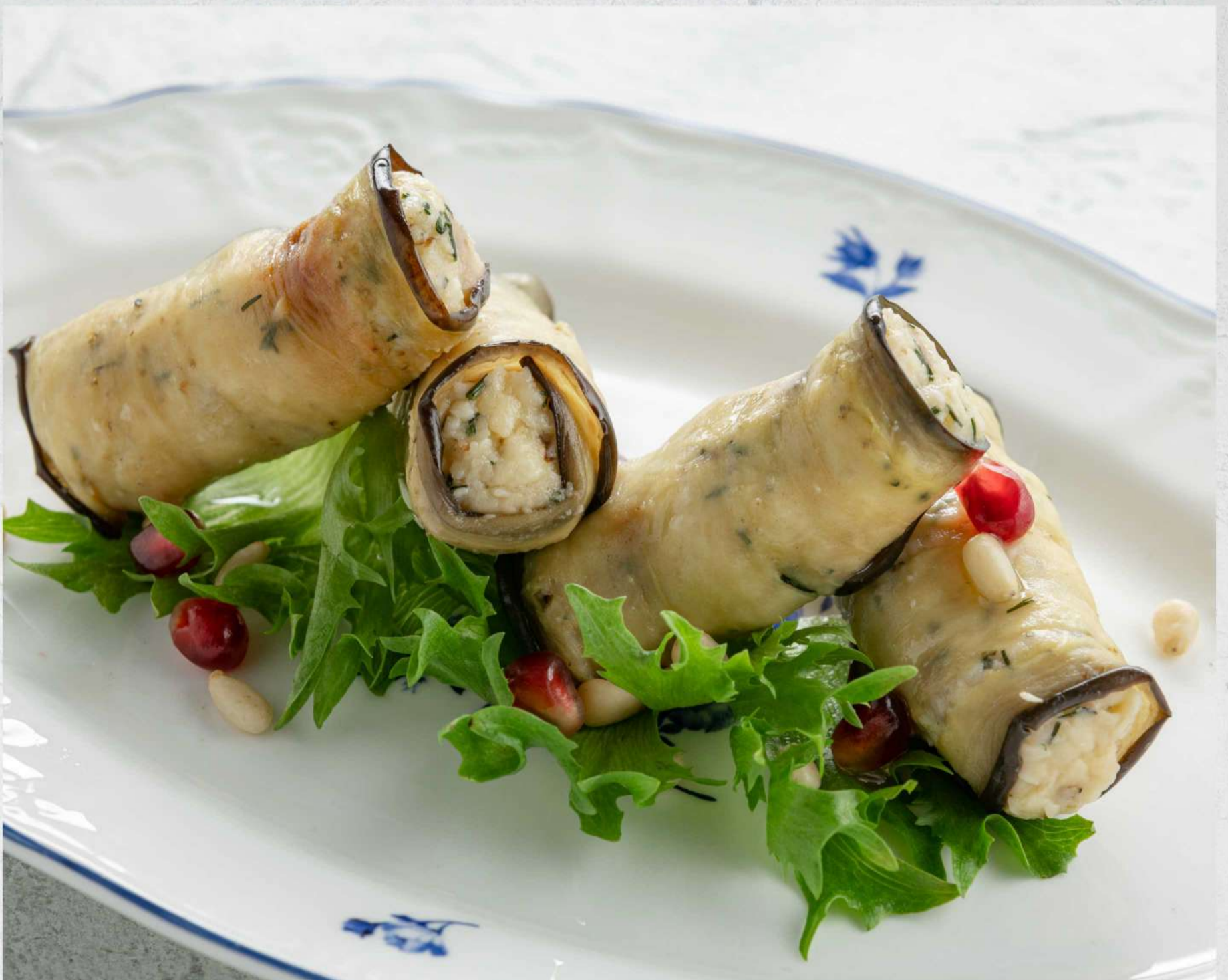
РУЛЕТКИ ИЗ БАКЛАЖАНОВ