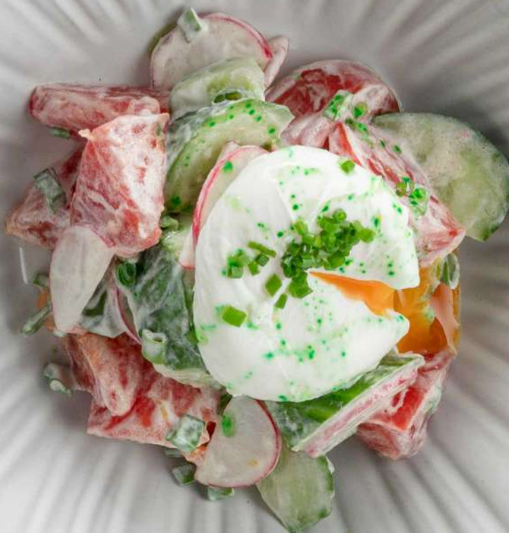
ОВОЩНОЙ САЛАТ С ЯЙЦОМ ПАШОТ 650₹