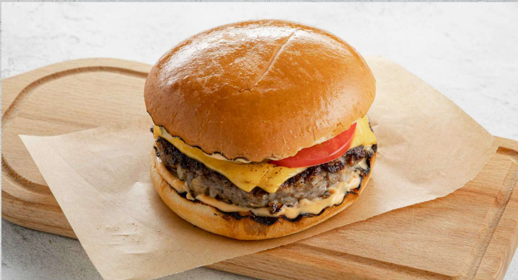
БУРГЕР С БИФШТЕКСОМ ИЗ МРАМОРНОЙ ГОВЯДИНЫ