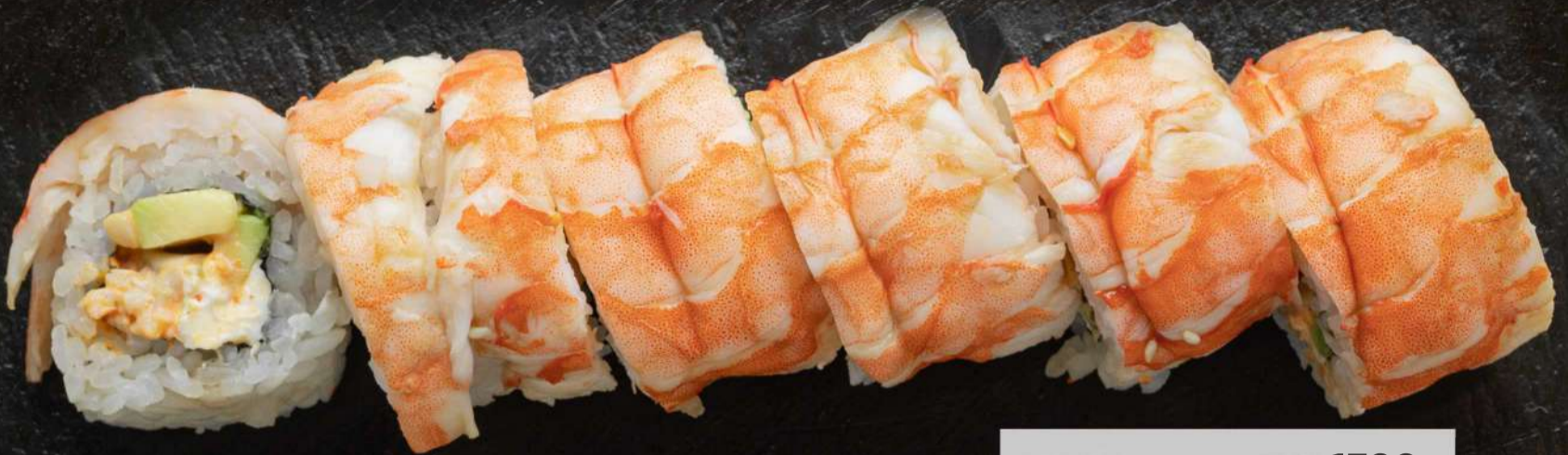
ФИЛАДЕЛЬФИЯ 1390 Р С КРЕВЕТКОЙ