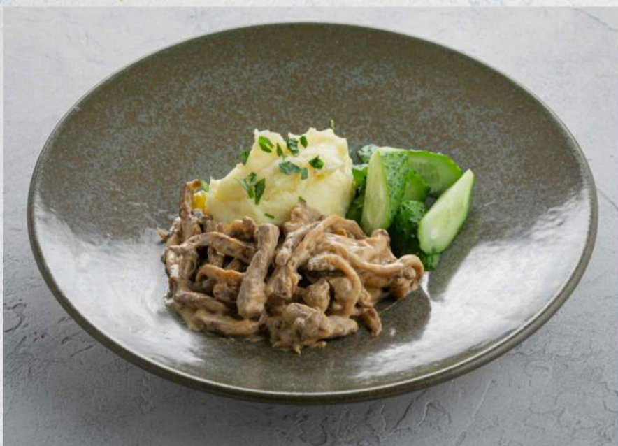
БЕФСТРОГАНОВ С ПЮРЕ