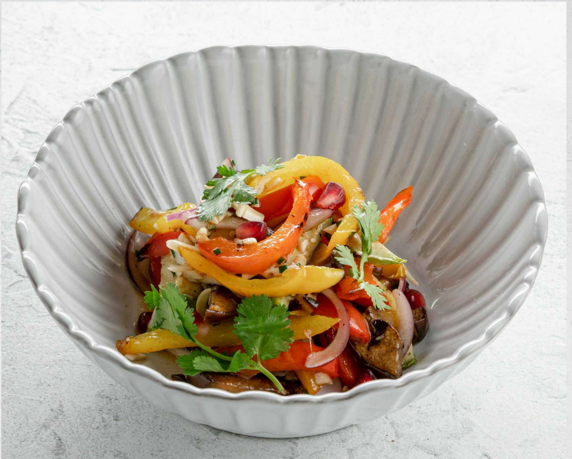
САЛАТ С ПЕЧЕНЫМИ ОВОЩАМИ