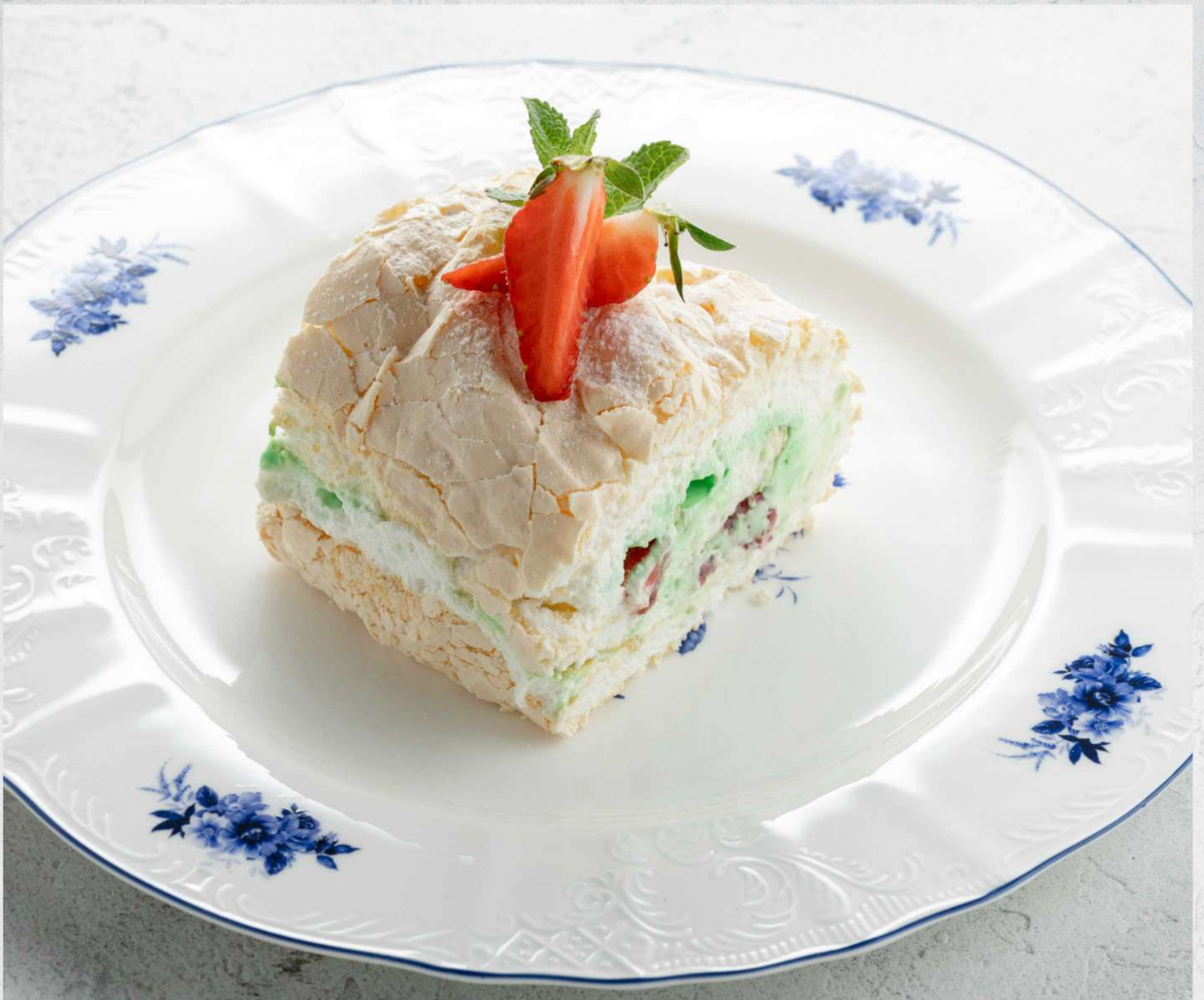
МЕРЕНГОВЫЙ РУЛЕТ С КЛУБНИКОЙ И МЯТОЙ