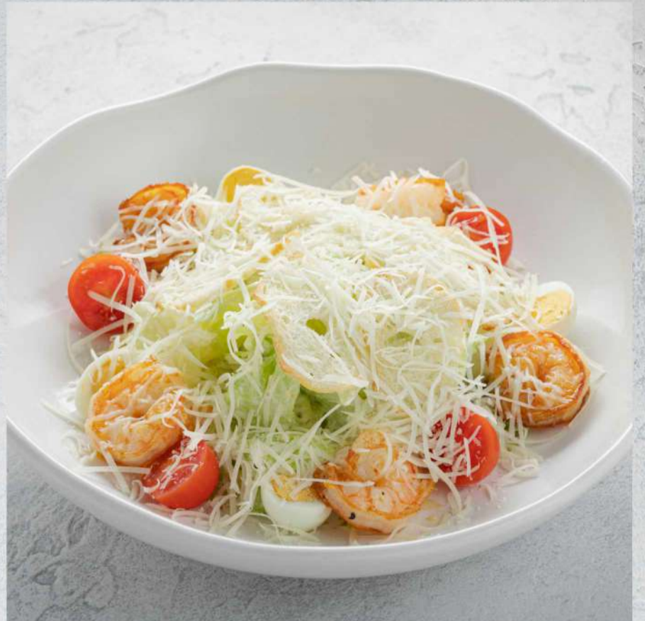
ЦЕЗАРЬ С КРЕВЕТКАМИ ЦЕЗАРЬ С ЦЫПЛЕНКОМ