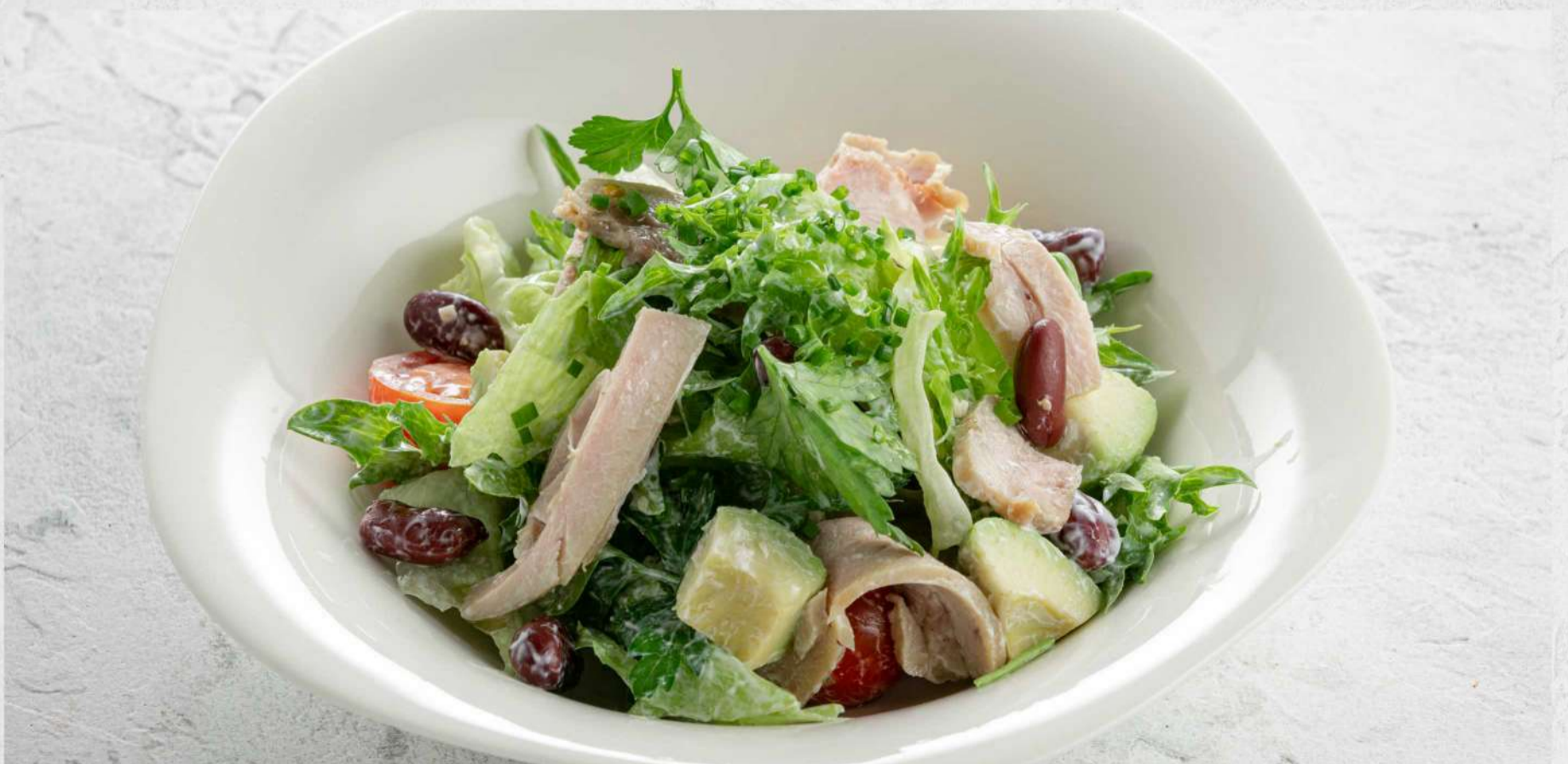
САЛАТ С ИНДЕЙКОЙ, АВОКАДО И ФАСОЛЬЮ