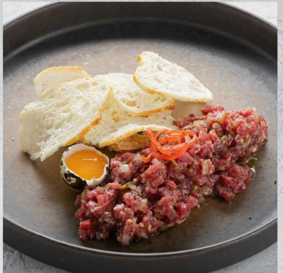
ТАРТАР ИЗ ГОВЯДИНЫ