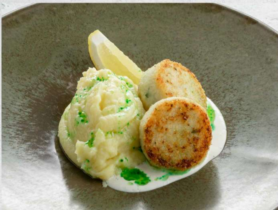
КОТЛЕТЫ ИЗ ТРЕСКИ С ПЮРЕ