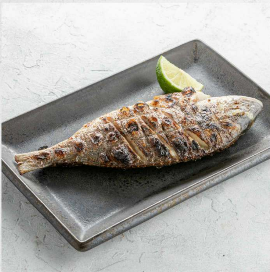
ДОРАДА НА ГРИЛЕ*