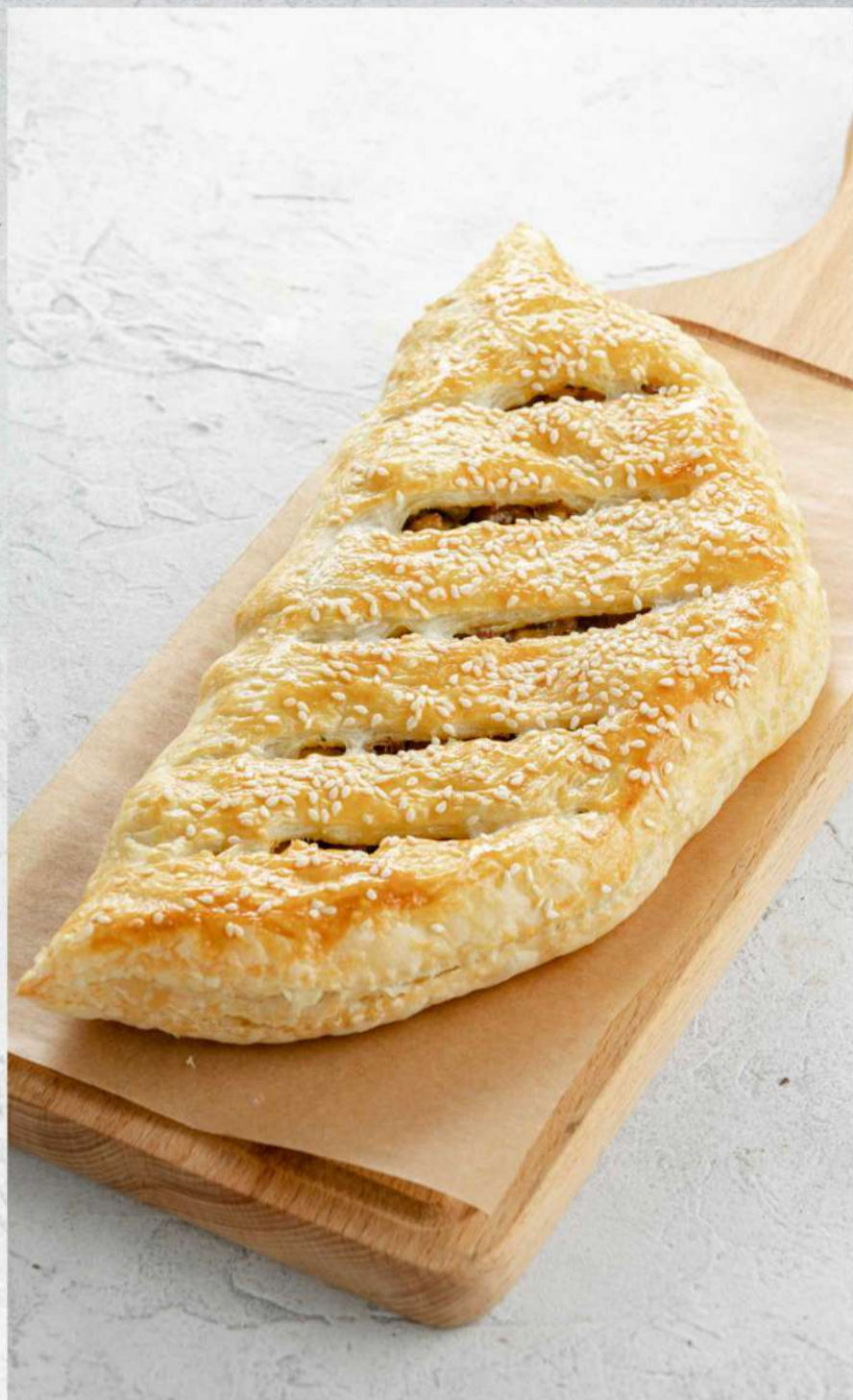
ДОМАШНИЙ ПИРОГ С КУРИЦЕЙ И ГРИБАМИ