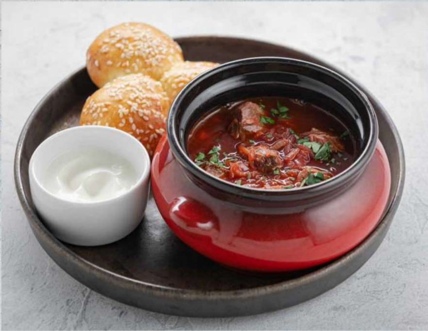
БОРЩ С ПАМПУШКАМИ