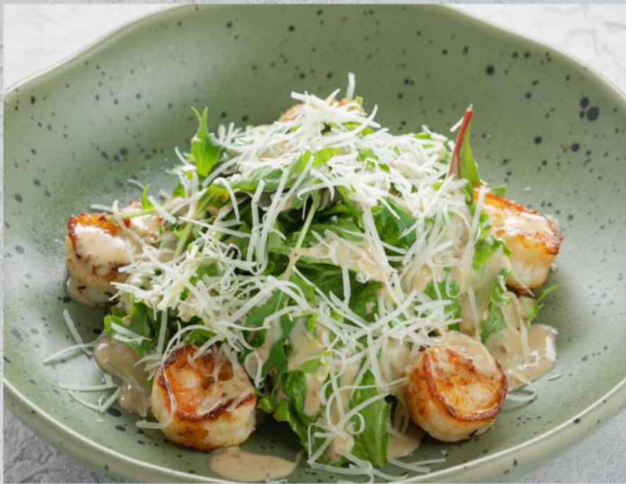
САЛАТ С КРЕВЕТКАМИ * И АВОКАДО