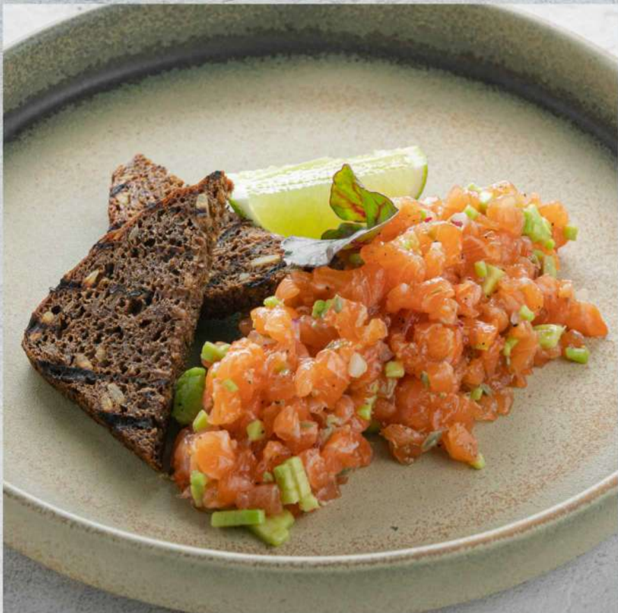
ТАРТАР ИЗ ЛОСОСЯ*