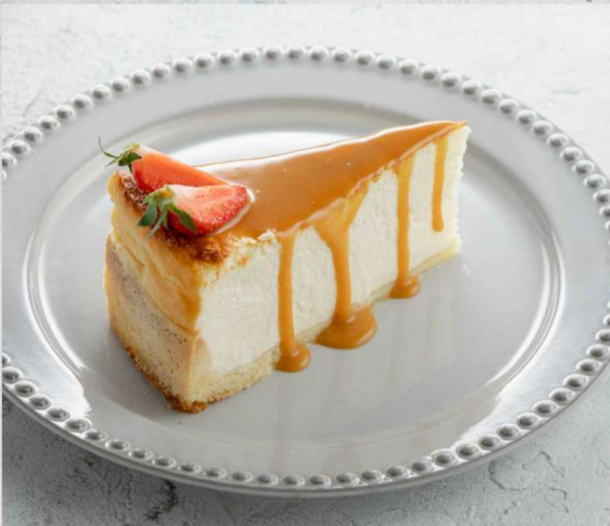
ЧИЗКЕЙК С СОЛЕНОЙ КАРАМЕЛЬЮ