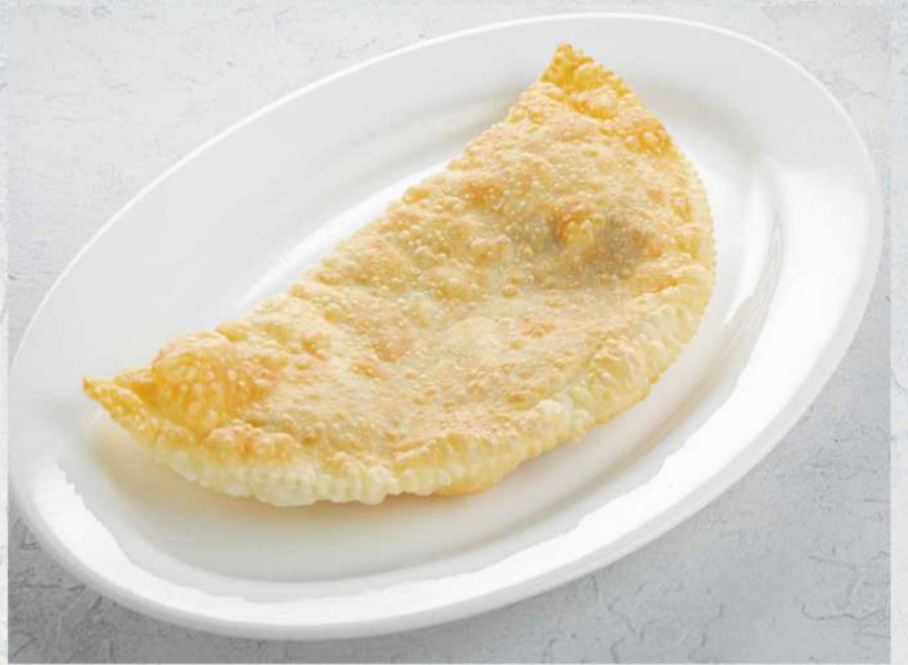
ЧЕБУРЕК С БАРАНИНОЙ (1 ШТ)