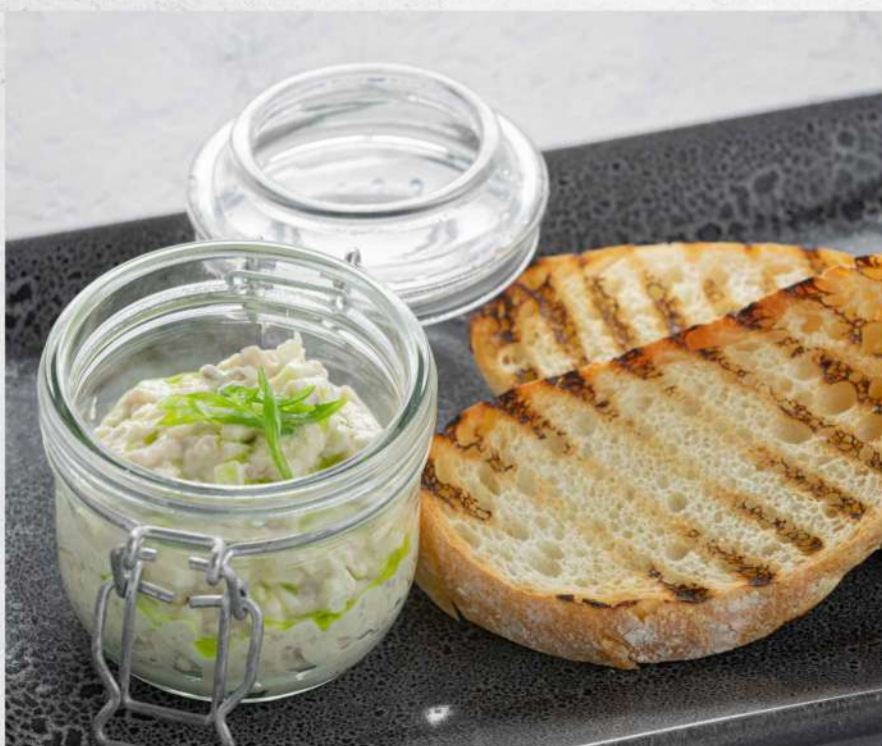
ФОРШМАК ИЗ СЕЛЬДИ