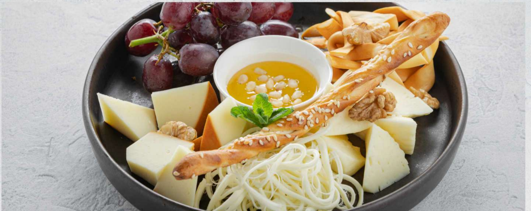
СЫРНАЯ ТАРЕЛКА (сулугуни копченый, чечил, имеретинский сыр, чечил копченый, мёд)