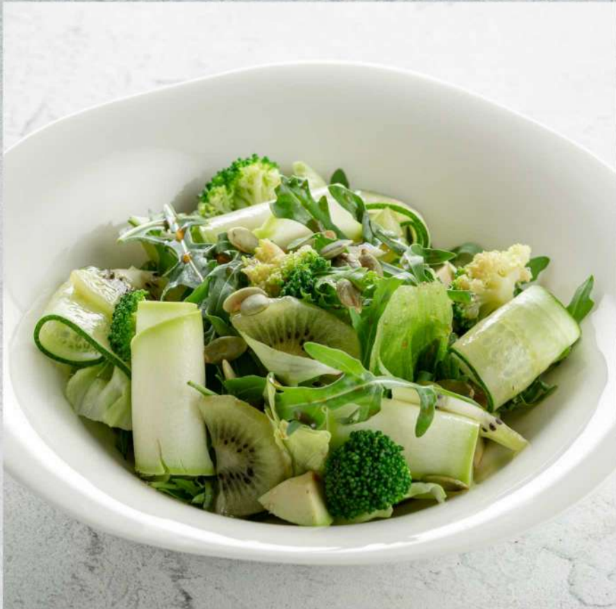
ЗЕЛЕНЬ С САЛАТ