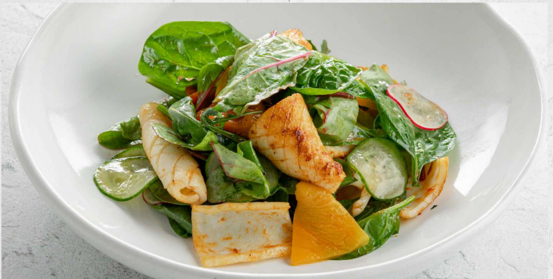
САЛАТ С КАЛЬМАРОМ И ЦИТРУСОВЫМ СОУСОМ *