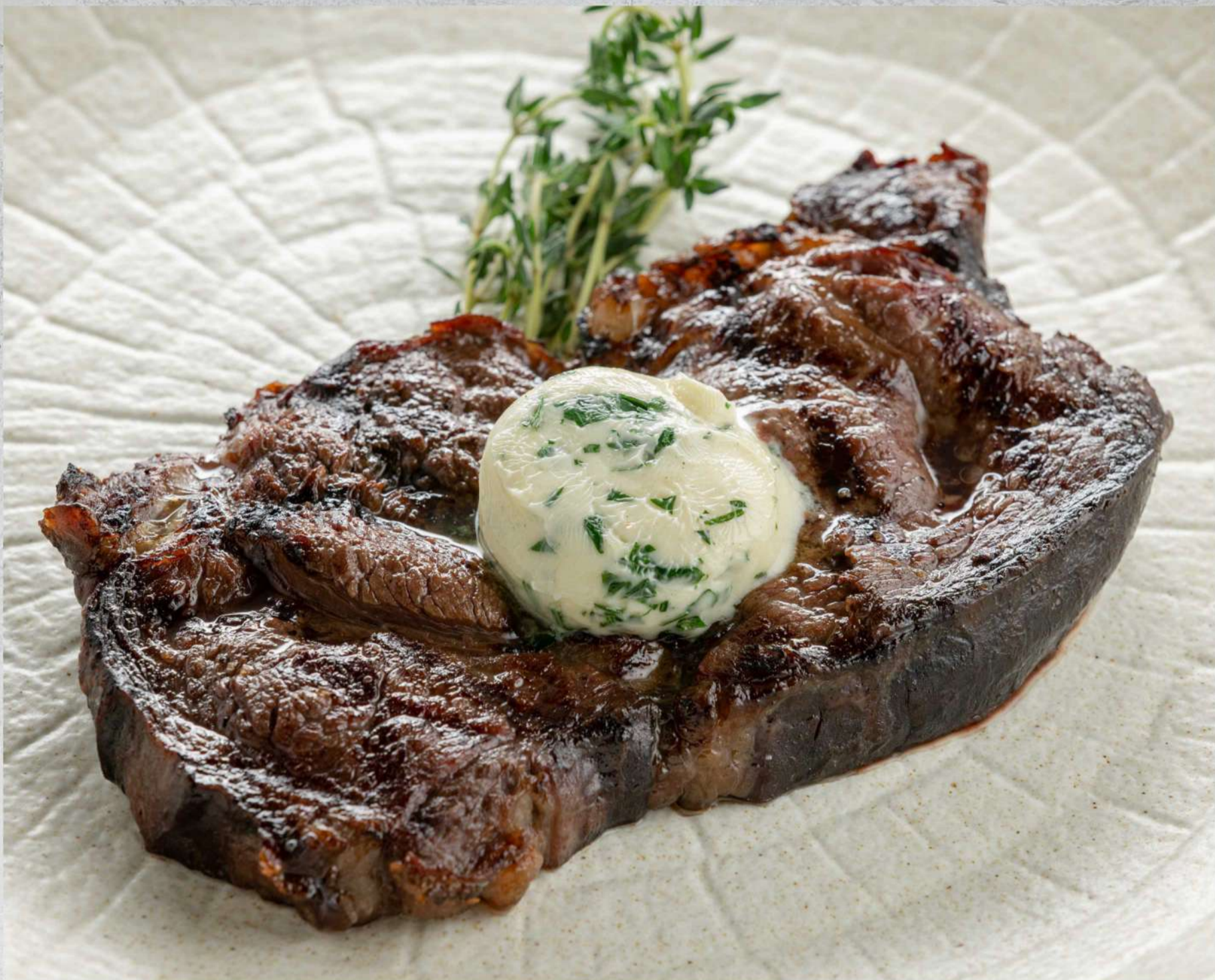
СТЕЙК РИБАЙ (мин. заказ от 200 гр)*