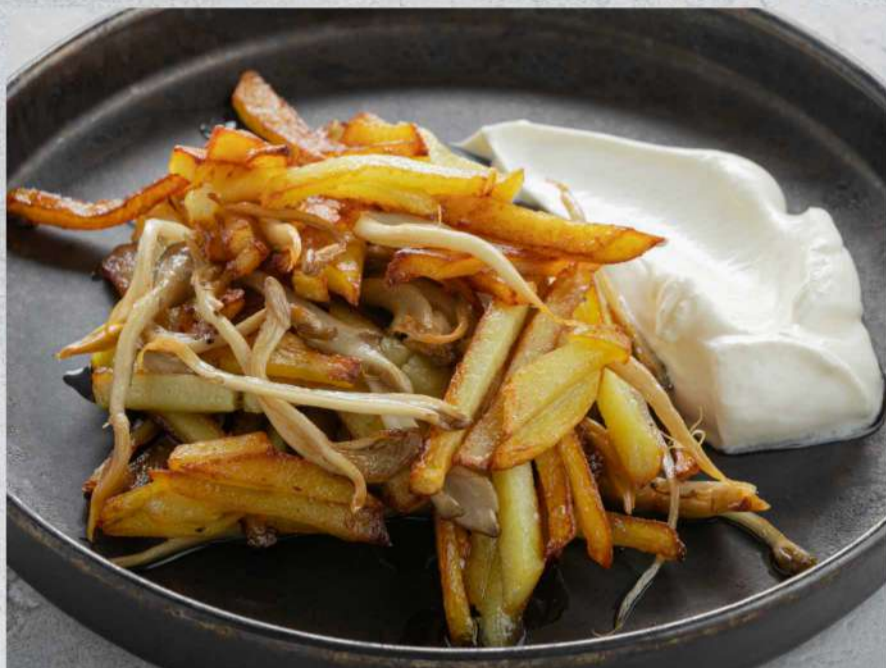
КАРТОФЕЛЬ ЖАРЕННЫЙ С ГРИБАМИ