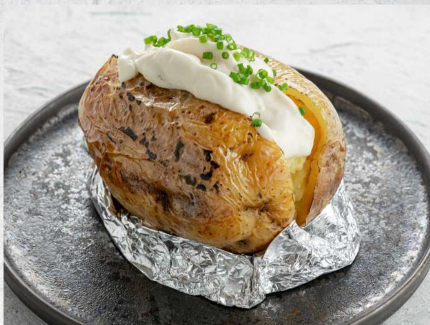
ЗАПЕЧЕННЫЙ КАРТОФЕЛЬ СО СЛИВОЧНЫМ СЫРОМ