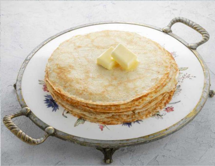
СКОВОРОДКА С БЛИНАМИ