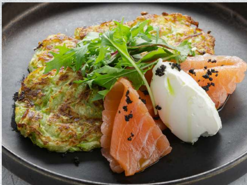
ОЛАДУШКИ ИЗ КАБАЧКА С ЛОСОСЕМ СЛАБОЙ СОЛИ