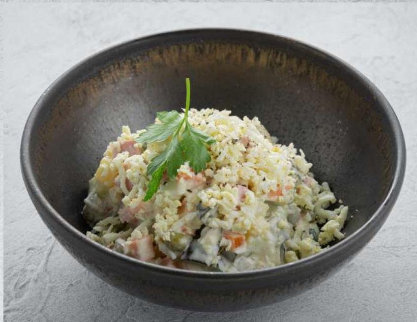
ОЛИВЬЕ С КОЛБАСОЙ