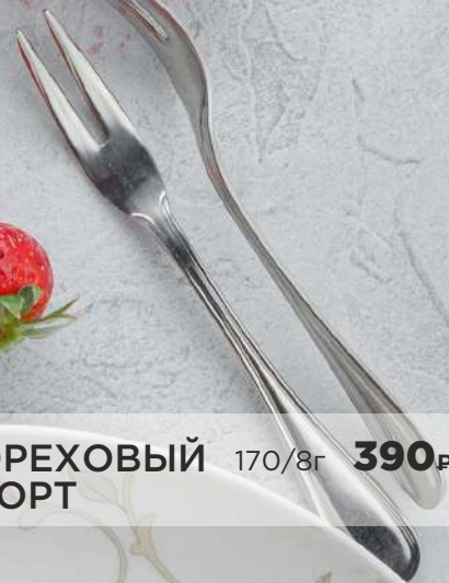
ОРЕХОВЫЙ ТОРТ 170/8г 390₽