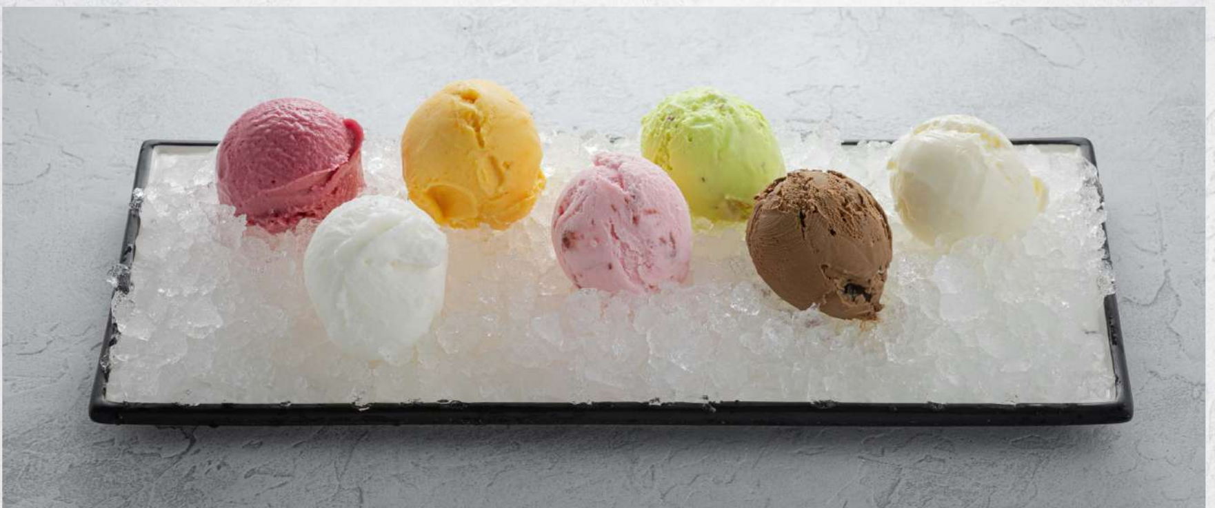
МОРОЖЕНОЕ / СОРБЕТ