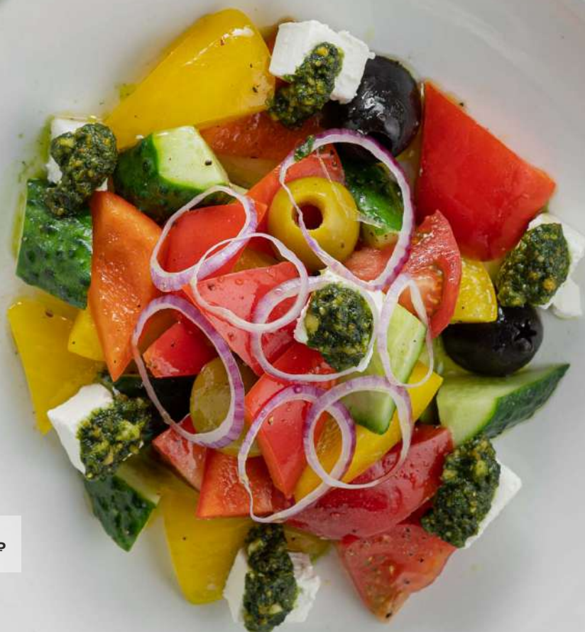
ГРЕЧЕСКИЙ САЛАТ 228г 680Р