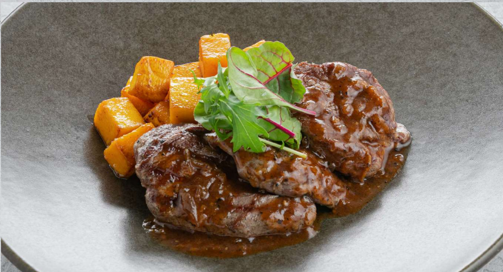
МЕДАЛЬОНЫ ИЗ МРАМОРНОЙ ГОВЯДИНЫ С ПЕРЕЧНЫМ СОУСОМ И ЗАПЕЧЕННОЙ ТЫКВОЙ