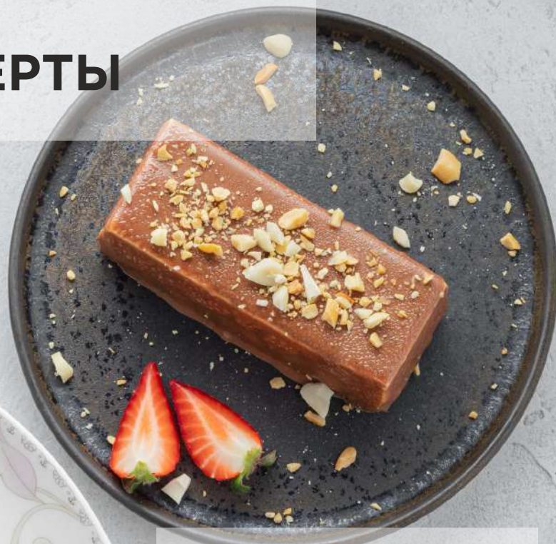
ПИРОЖНОЕ «СНИКЕРС» 150/8/3г 450₽