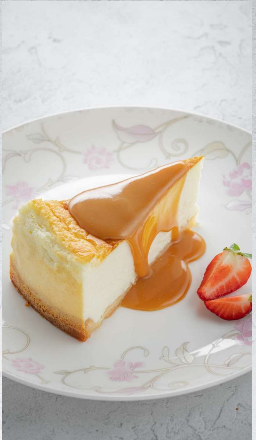
ЧИЗКЕЙК С СОЛЕНОЙ КАРАМЕЛЬЮ