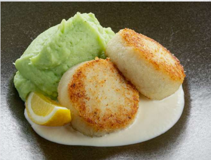
КОТЛЕТЫ ИЗ ТРЕСКИ С БАЗИЛКОВЫМ ПЮРЕ