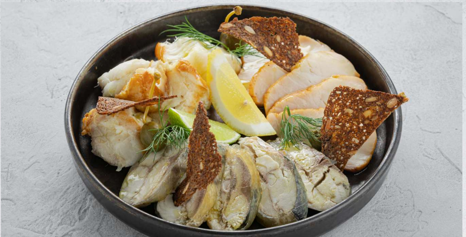
РЫБНОЕ АССОРТИ (рулет из скумбрии г/к, клыкач х/к, зубатка г/к)