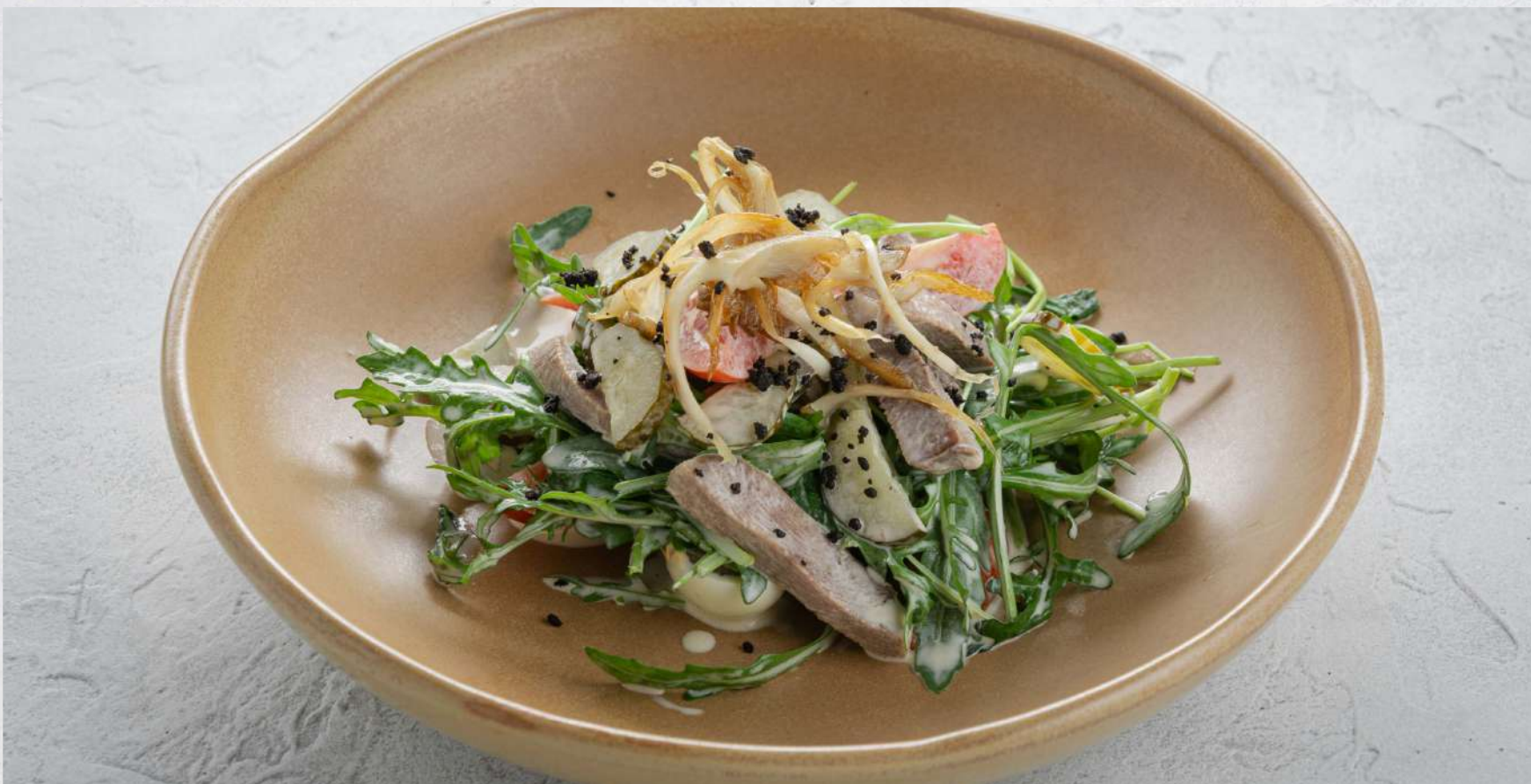
ТЕПЛЫЙ САЛАТ С ТЕЛЯЧЬИМ ЯЗЫКОМ