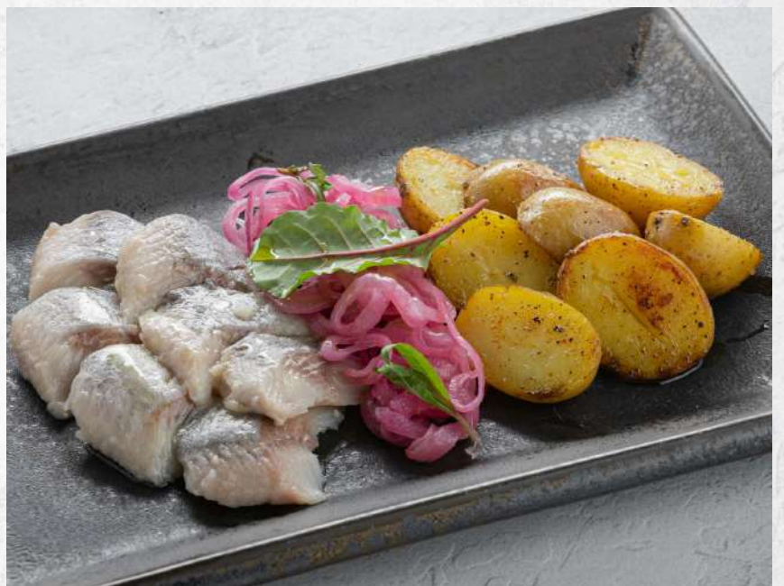
СЕЛЬДЬ С МОЛОДЫМ КАРТОФЕЛЕМ