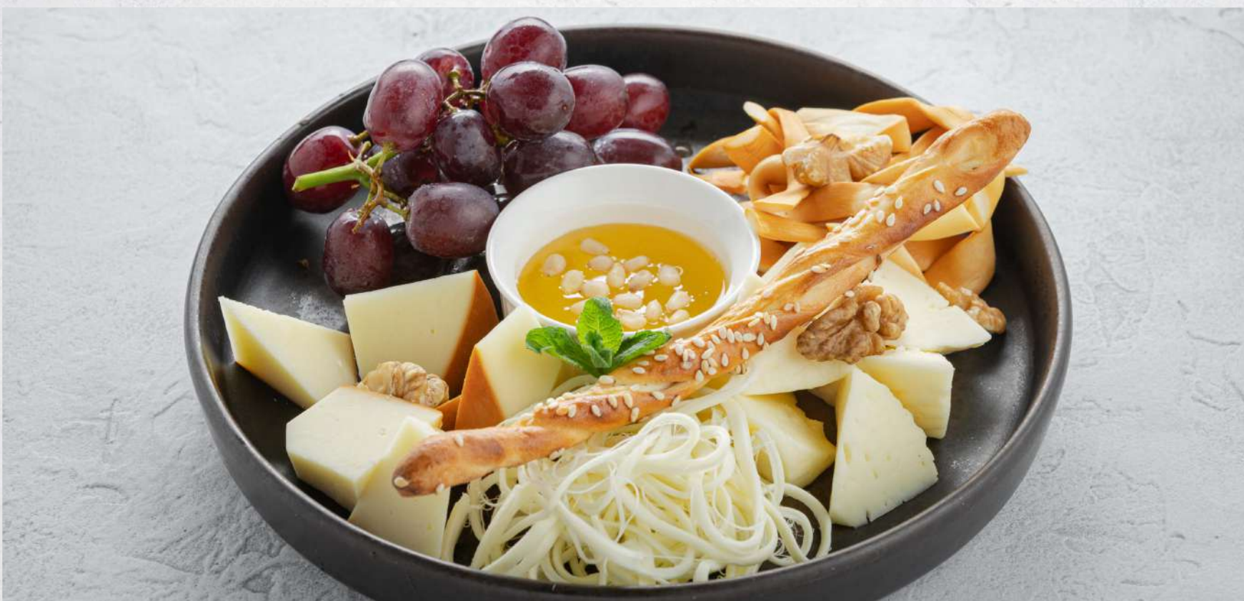
СЫРНАЯ ТАРЕЛКА (сулугуни копченый, чечил, имеретинский сыр, чечил копченый, мёд)