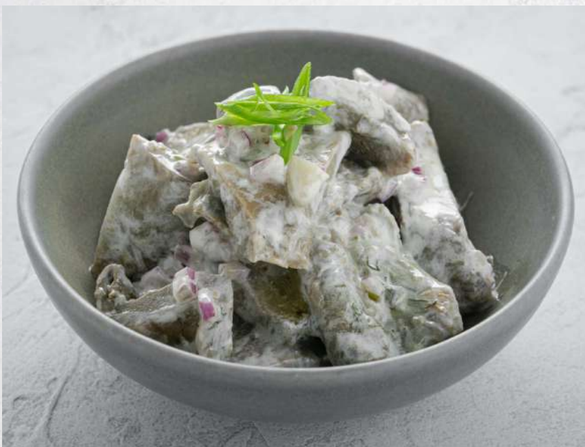
БЕЛЫЕ ГРУЗДИ СО СМЕТАНОЙ