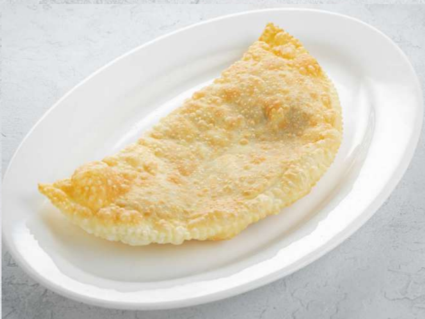
ЧЕБУРЕК С БАРАНИНОЙ (1 ШТ)