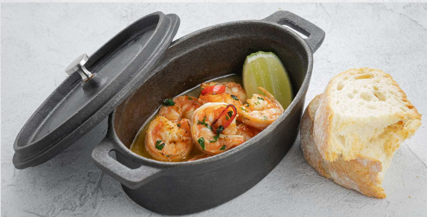
ГОРЯЧАЯ ЗАКУСКА ИЗ КРЕВЕТОК *