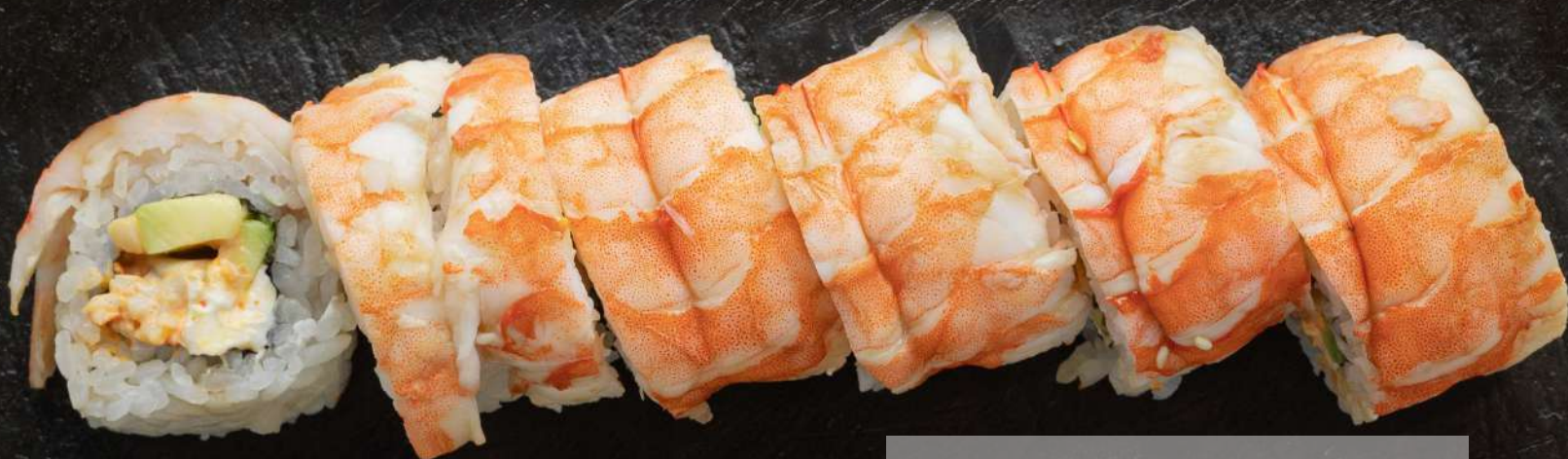
ФИЛАДЕЛЬФИЯ 230/30г 790Р С КРЕВЕТКОЙ