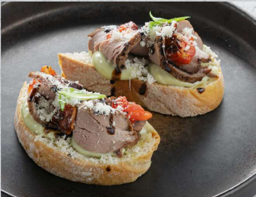
БРУСКЕТТА С РОСТБИФОМ