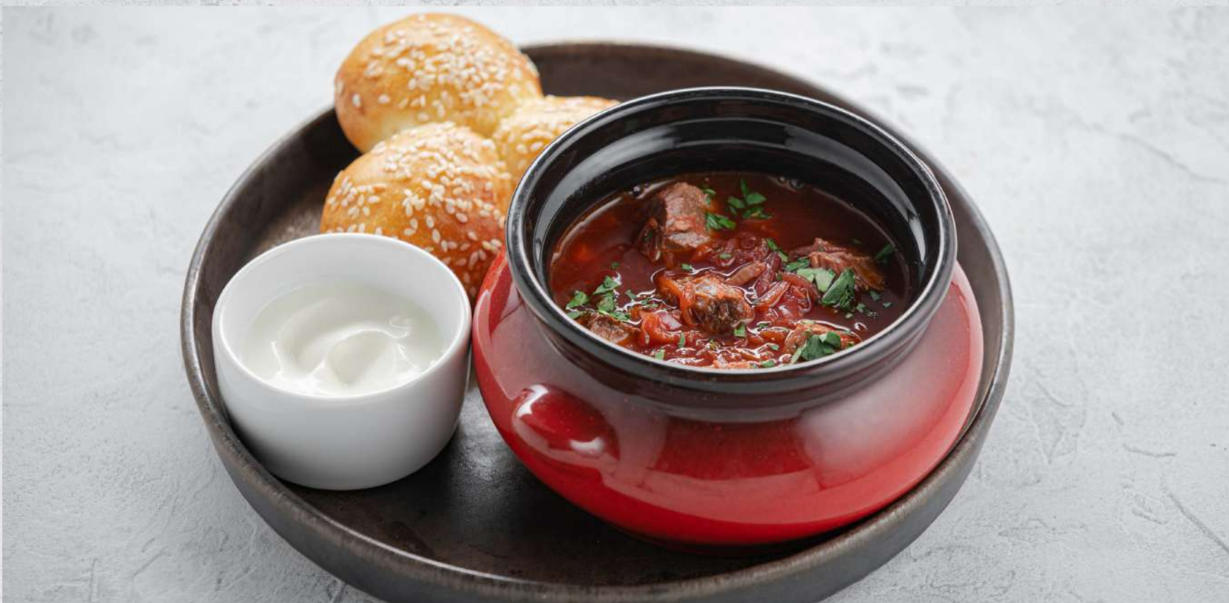
БОРЩ С ПАМПУШКАМИ