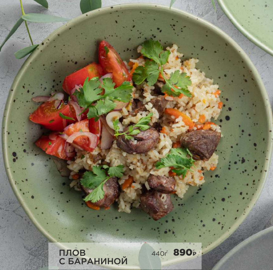
ПЛОВ С БАРАНИНОЙ 440г 890₽