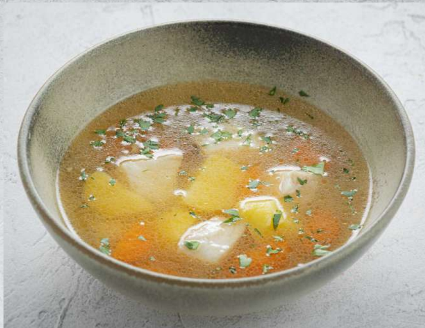
СЛИВОЧНЫЙ РЫБНЫЙ СУП РЫБНЫЙ СУП