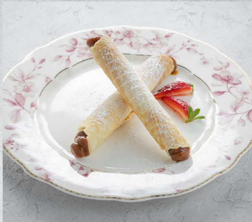
ТРУБОЧКИ СО СГУЩЕНКОЙ