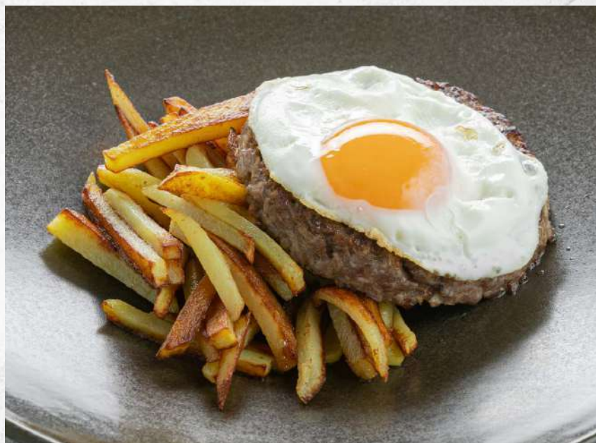
БИФШТЕКС С ЖАРЕННЫМ КАРТОФЕЛЕМ