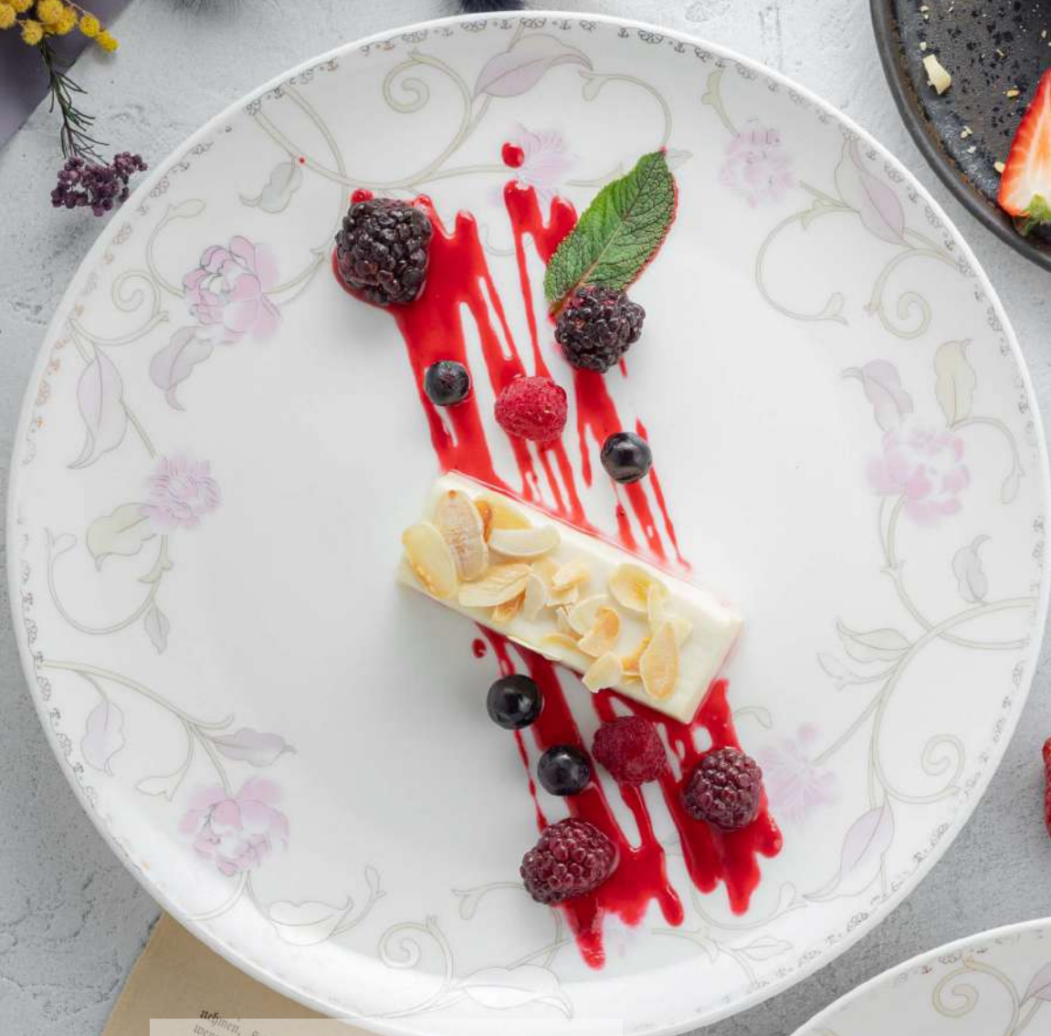
ПАНАКОТА 121/2/2г 370₽