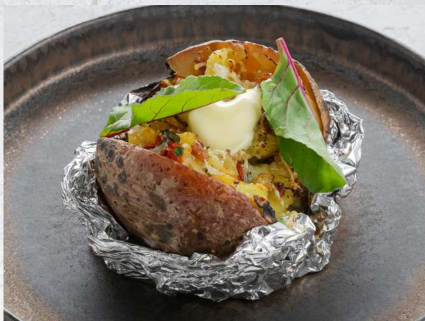
ЗАПЕЧЕННЫЙ КАРТОФЕЛЬ С БЕКОНОМ И ТОМАТАМИ