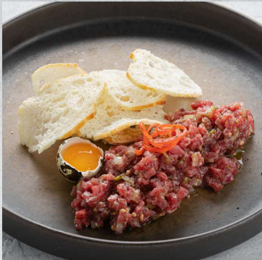
ТАРТАР ИЗ ГОВЯДИНЫ