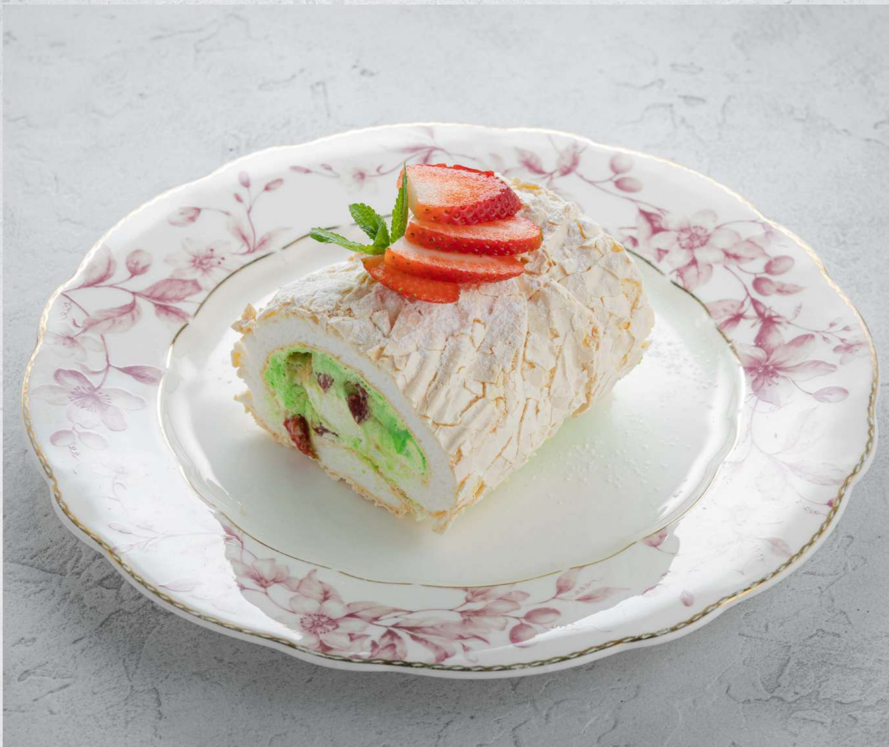
МЕРЕНГОВЫЙ РУЛЕТ С КЛУБНИКОЙ И МЯТОЙ