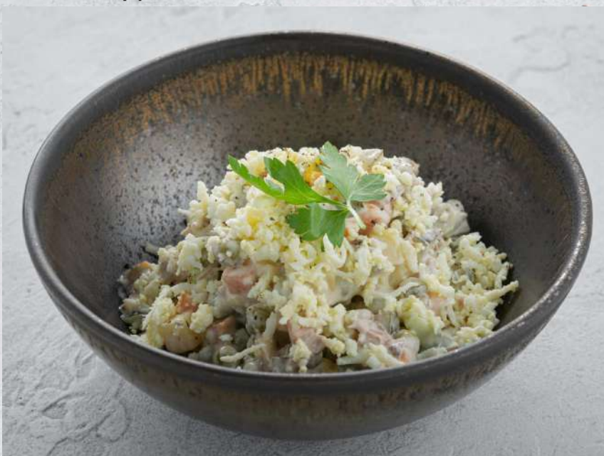
ОЛИВЬЕ С ГОВЯДИНОЙ