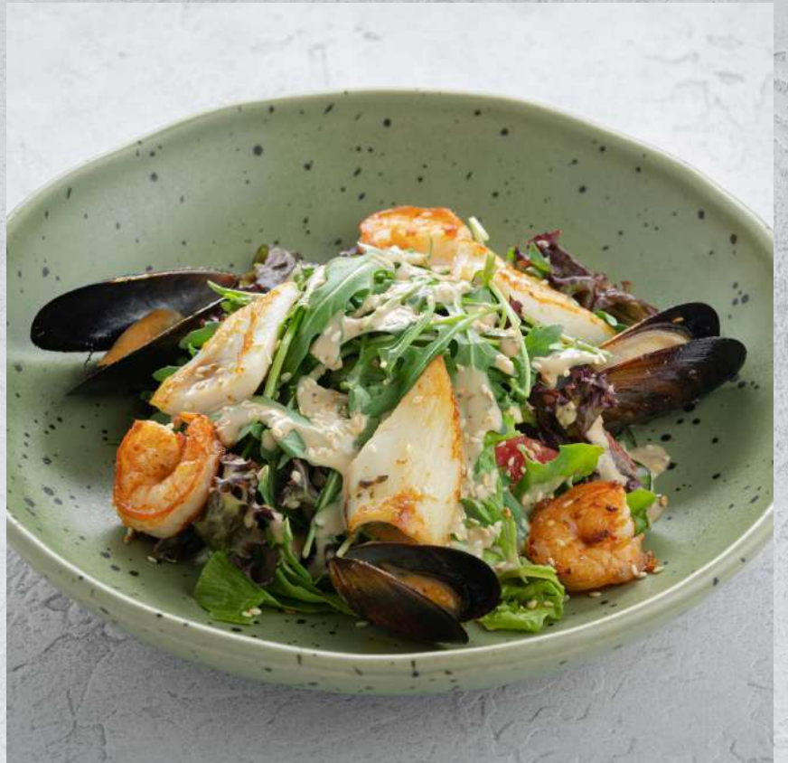
САЛАТ С МОРЕПРОДУКТАМИ