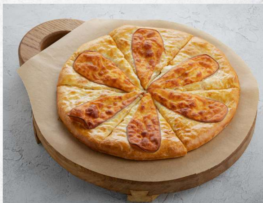
ХАЧАПУРИ С КОПЧЕНЫМ СЫРОМ