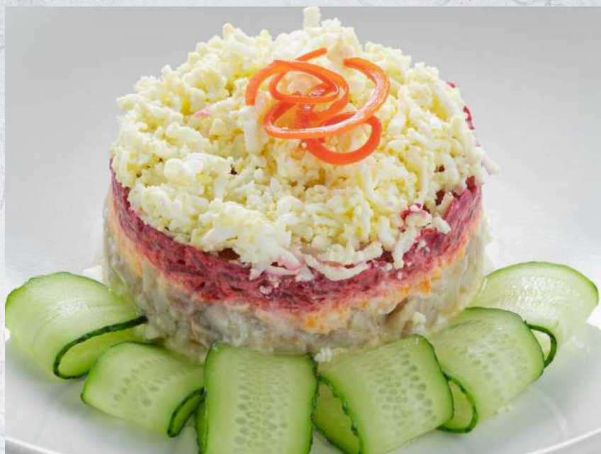
СЕЛЕДКА ПОД ШУБОЙ