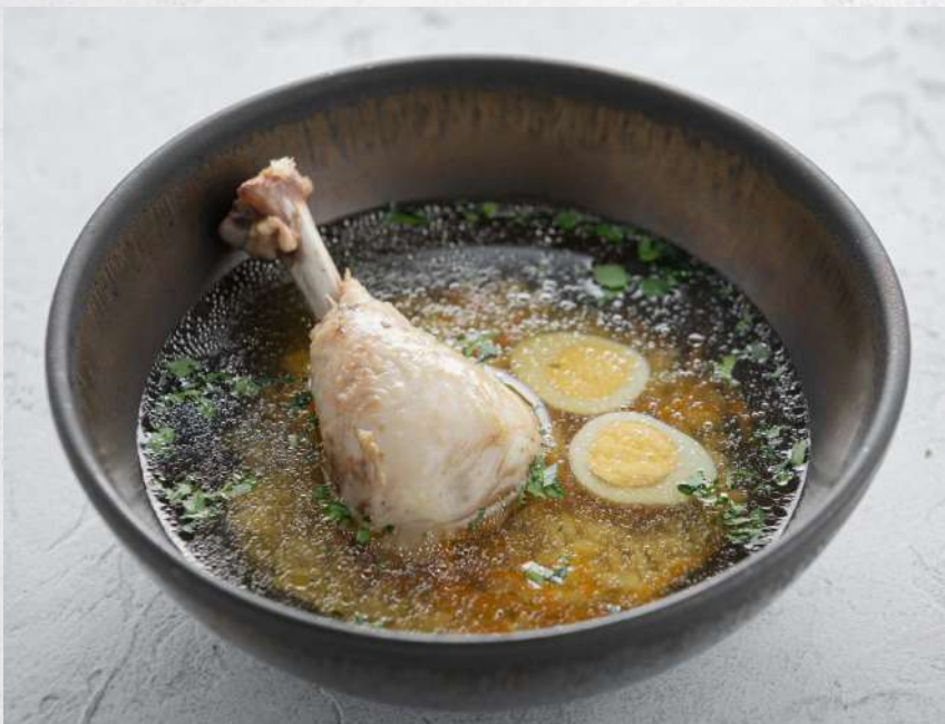
КУРИНЫЙ СУП С ОРЗО