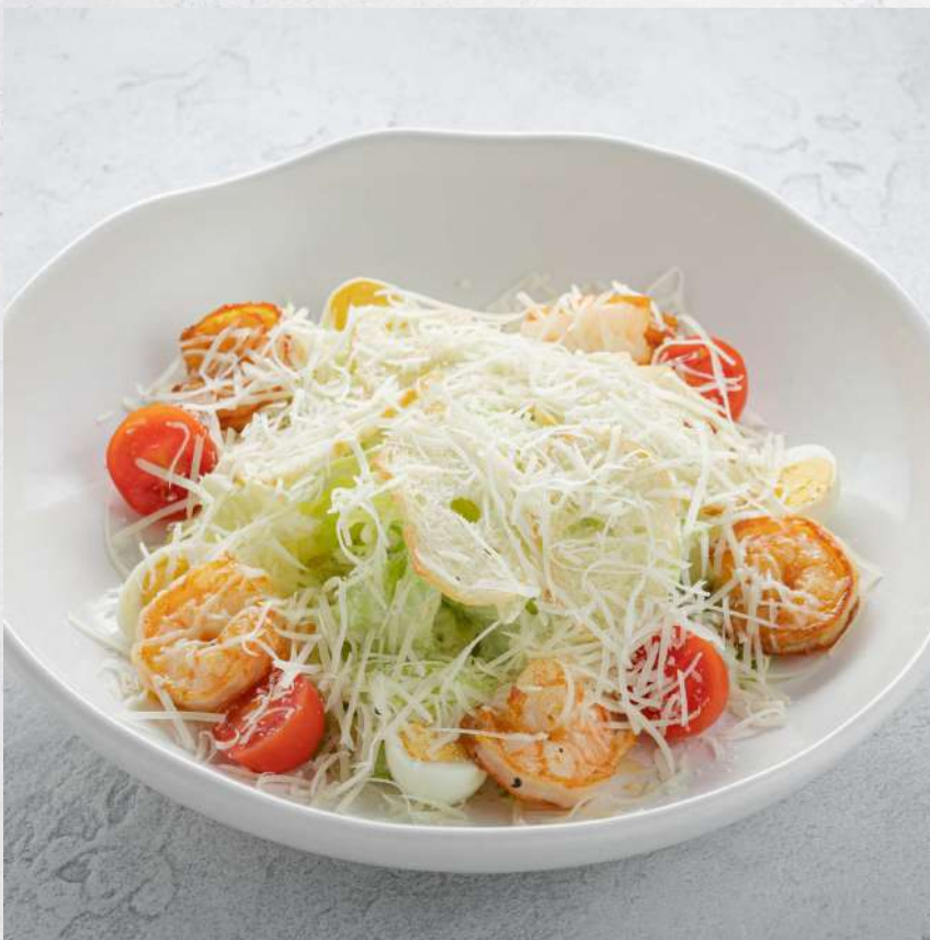
ЦЕЗАРЬ С КРЕВЕТКАМИ