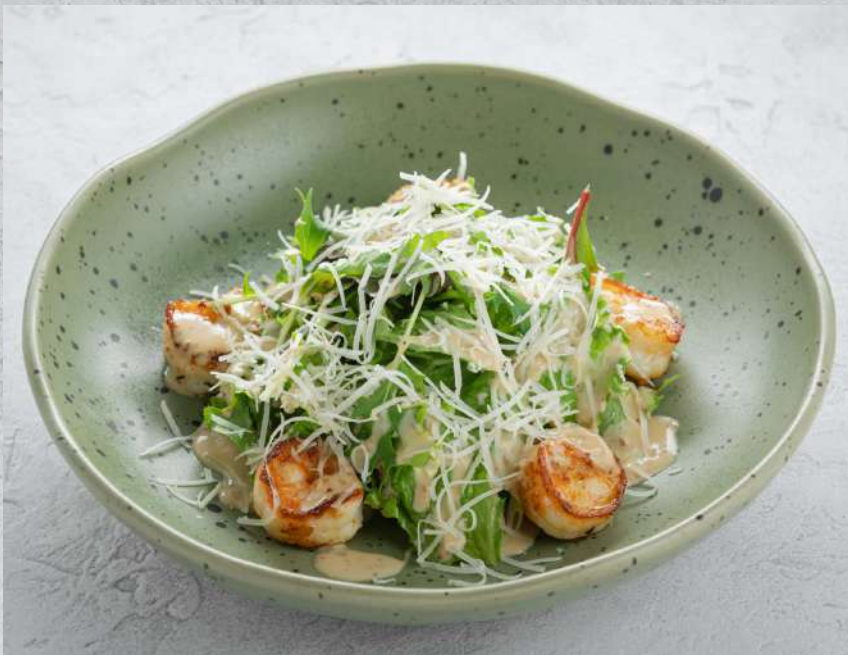
САЛАТ С КРЕВЕТКАМИ И АВОКАДО