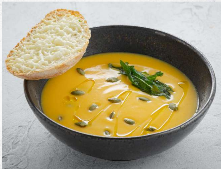
КРЕМ-СУП ИЗ ТЫКВЫ