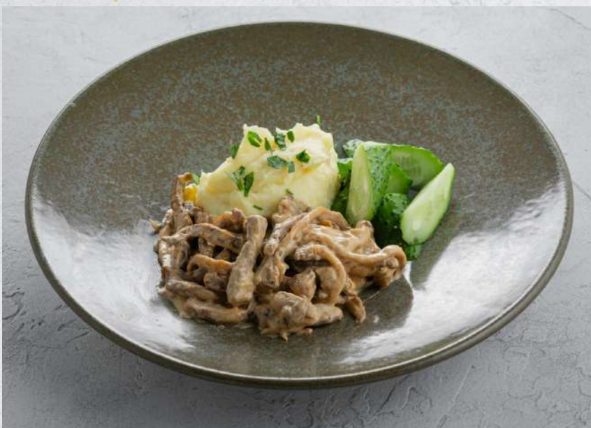
БЕФСТРОГАНОВ С ПЮРЕ