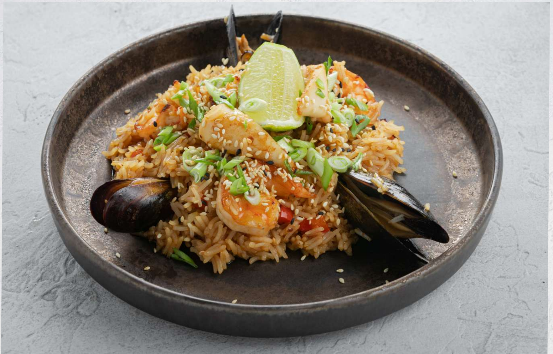
РИС С МОРЕПРОДУКТАМИ