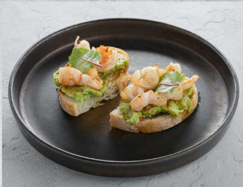
БРУСКЕТТА С КРЕВЕТКАМИ