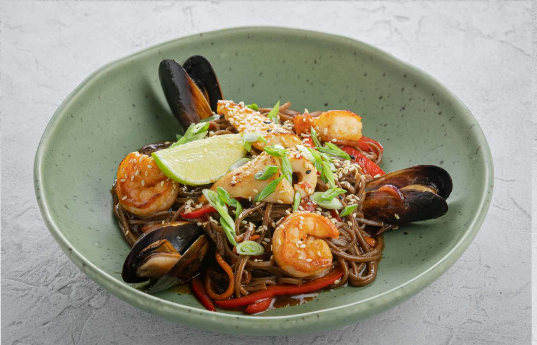
ВОК С МОРЕПРОДУКТАМИ