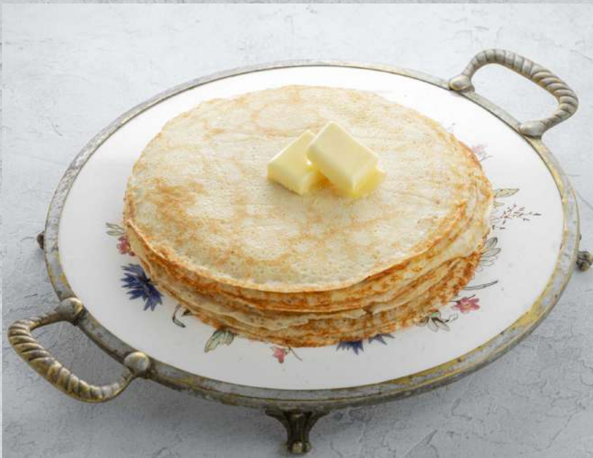
СКОВОРОДКА С БЛИНАМИ