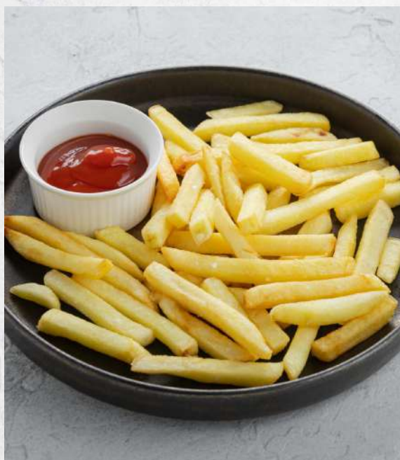
КАРТОФЕЛЬ ФРИ 150/50г 430₽