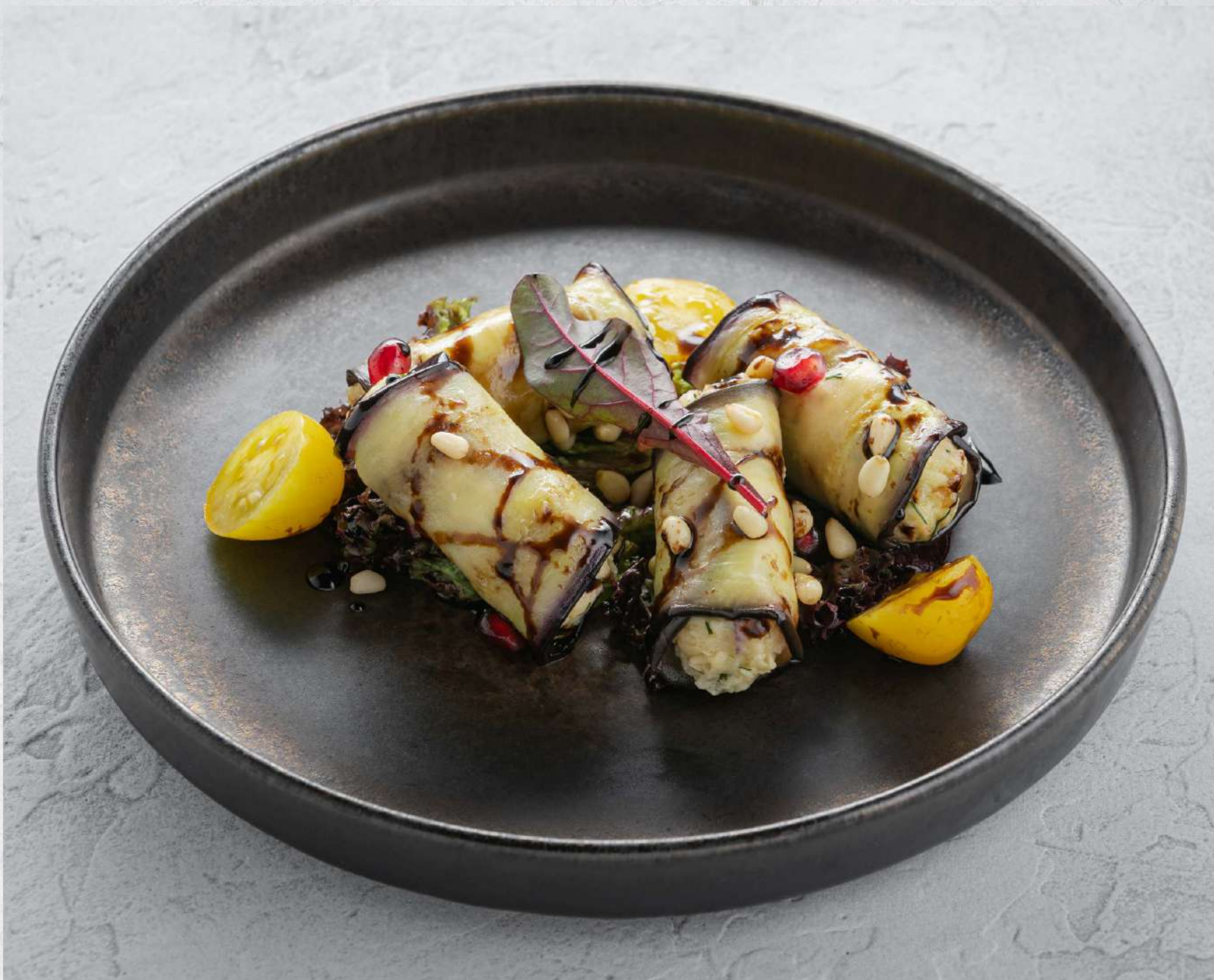
РУЛЕТКИ ИЗ БАКЛАЖАНОВ