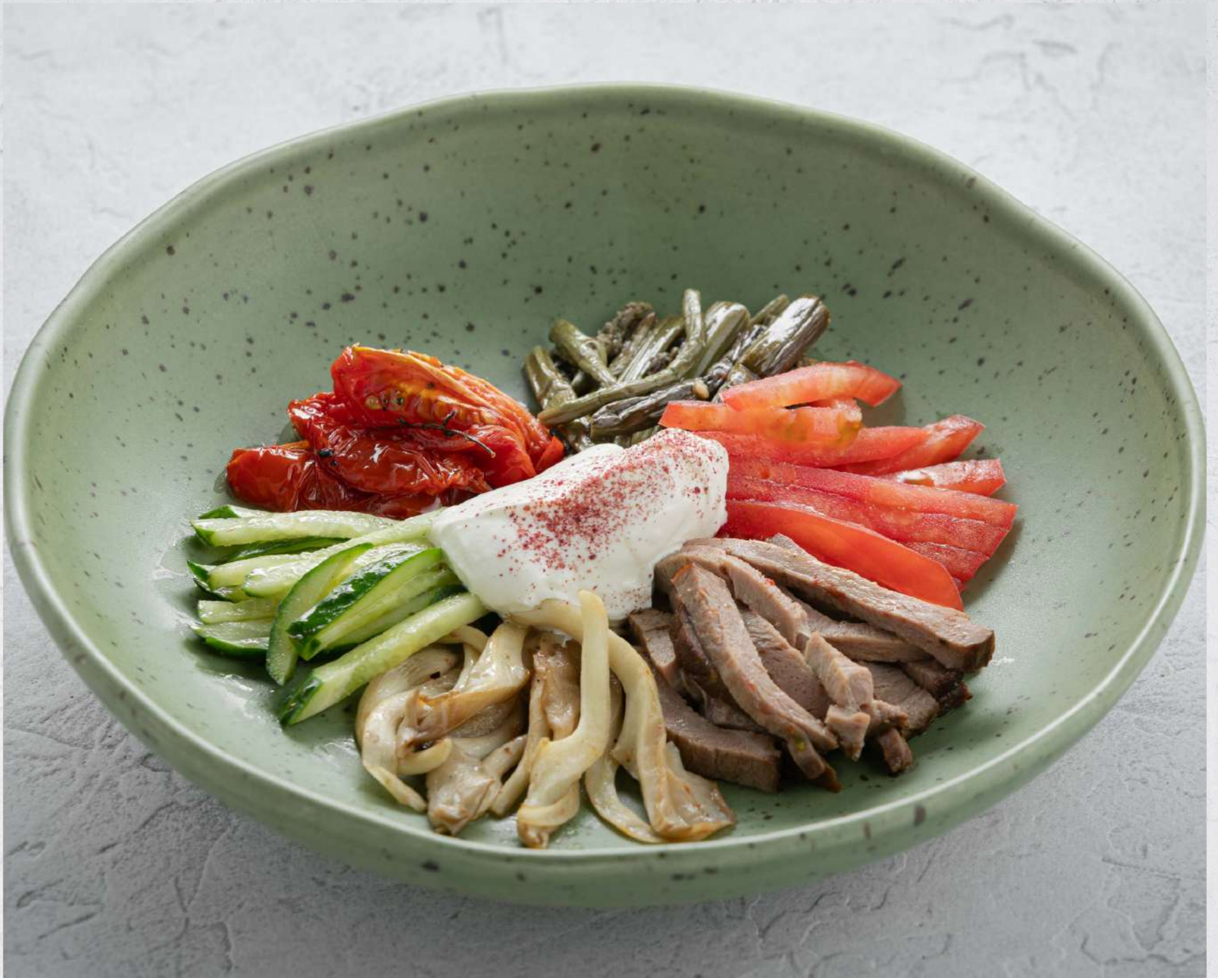
САЛАТ С ПАПОРТНИКОМ И КОПЧЕНОЙ СМЕТАНОЙ *