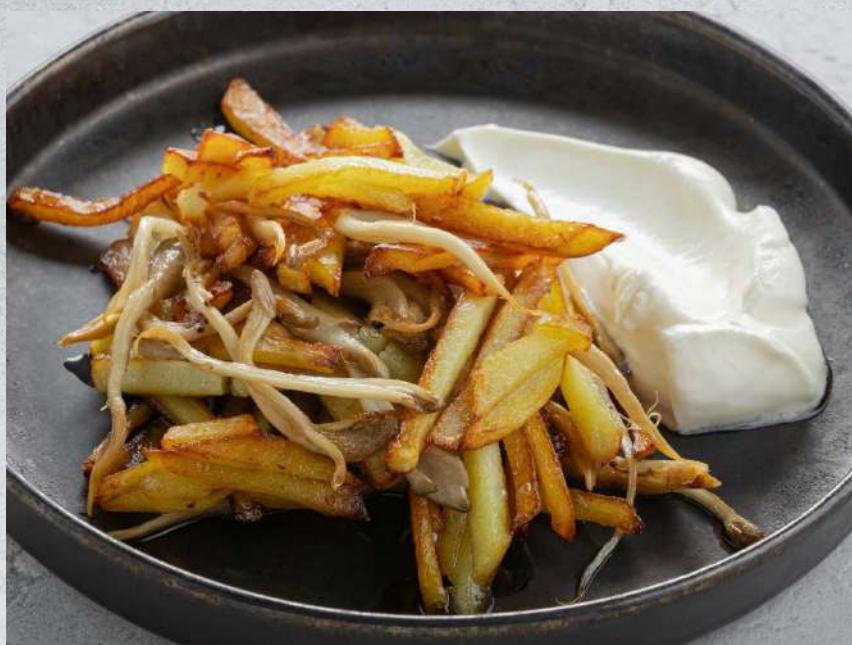
КАРТОФЕЛЬ ЖАРЕННЫЙ С ГРИБАМИ