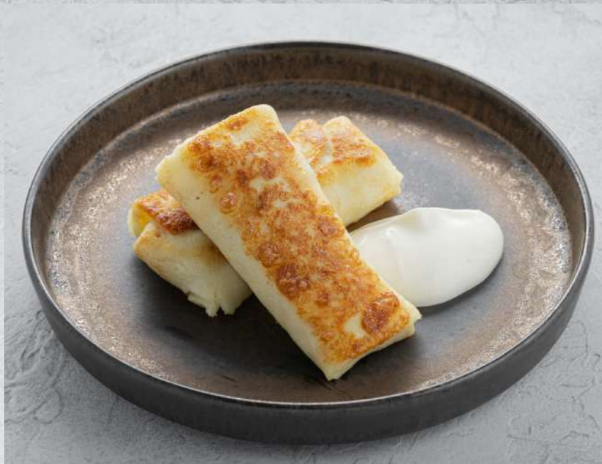
БЛИНЧИКИ С МЯСОМ