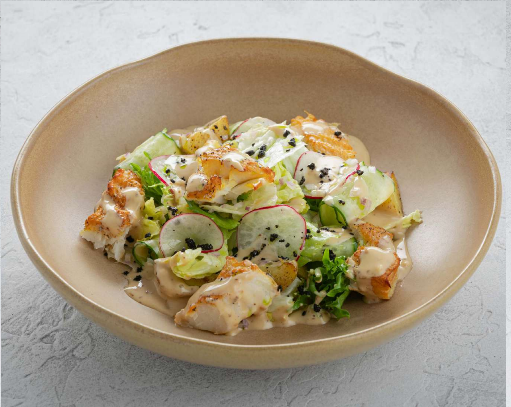
САЛАТ С ТРЕСКОЙ