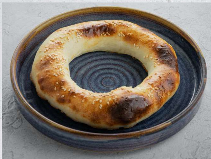
ЛЕПЕШКА ИЗ ТАНДЫРА С СЫРОМ