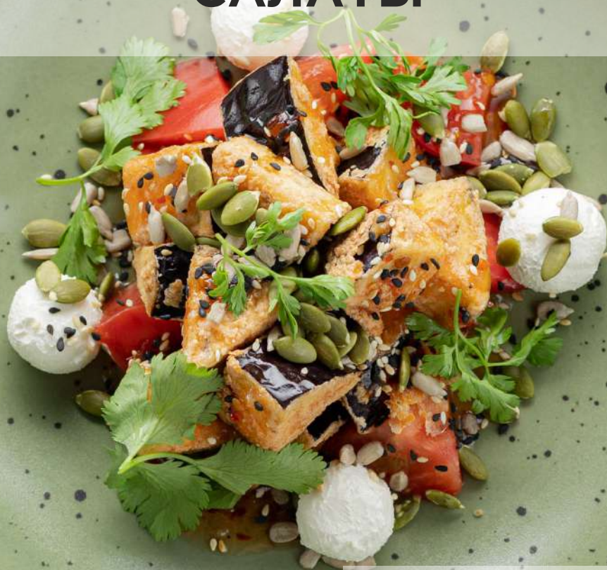
САЛАТ С ХРУСТЯЩИМИ 221г 650Р БАКЛАЖАНАМИ И СЛИВОЧНЫМ СЫРОМ