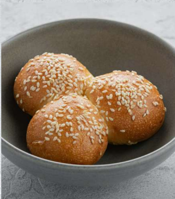
60г 80₽ ЛЕПЕШКА ИЗ ТАНДЫРА