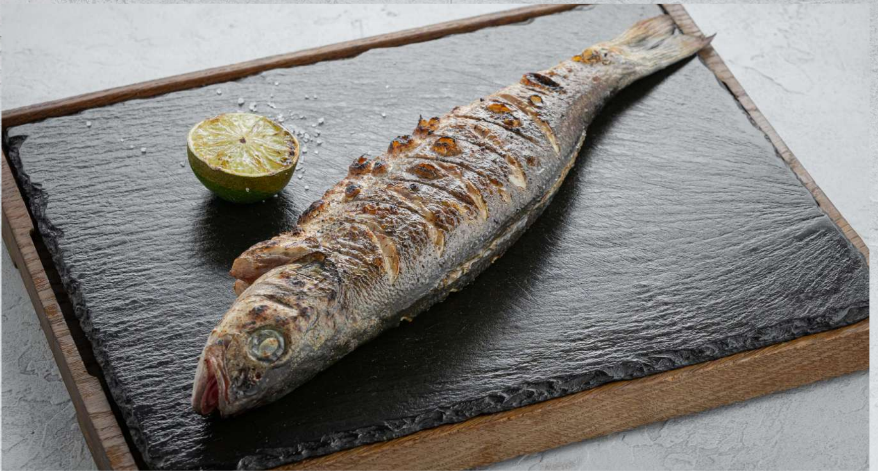
СИБАС НА ГРИЛЕ/В КОПТИЛЬНЕ (на выбор)