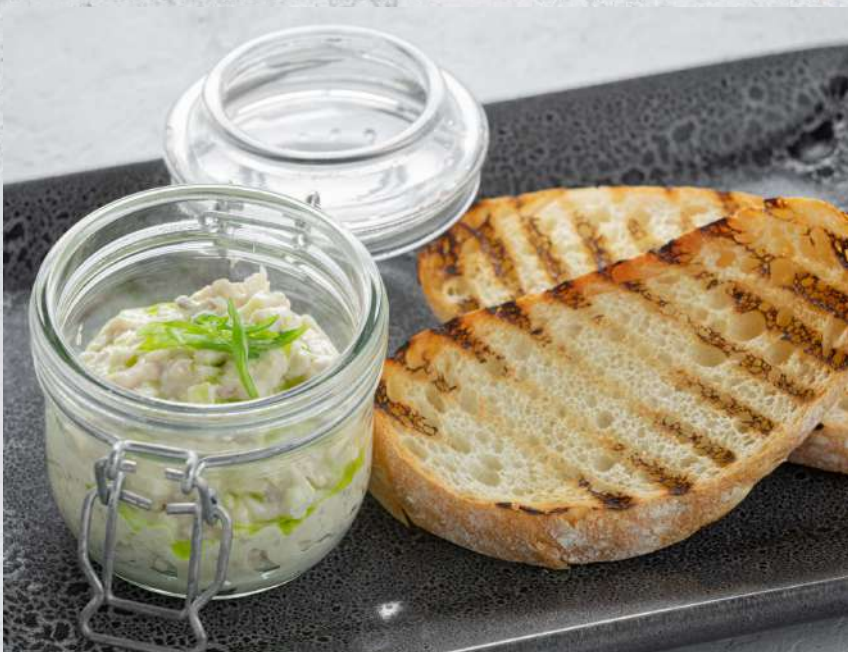
ФОРШМАК ИЗ СЕЛЬДИ