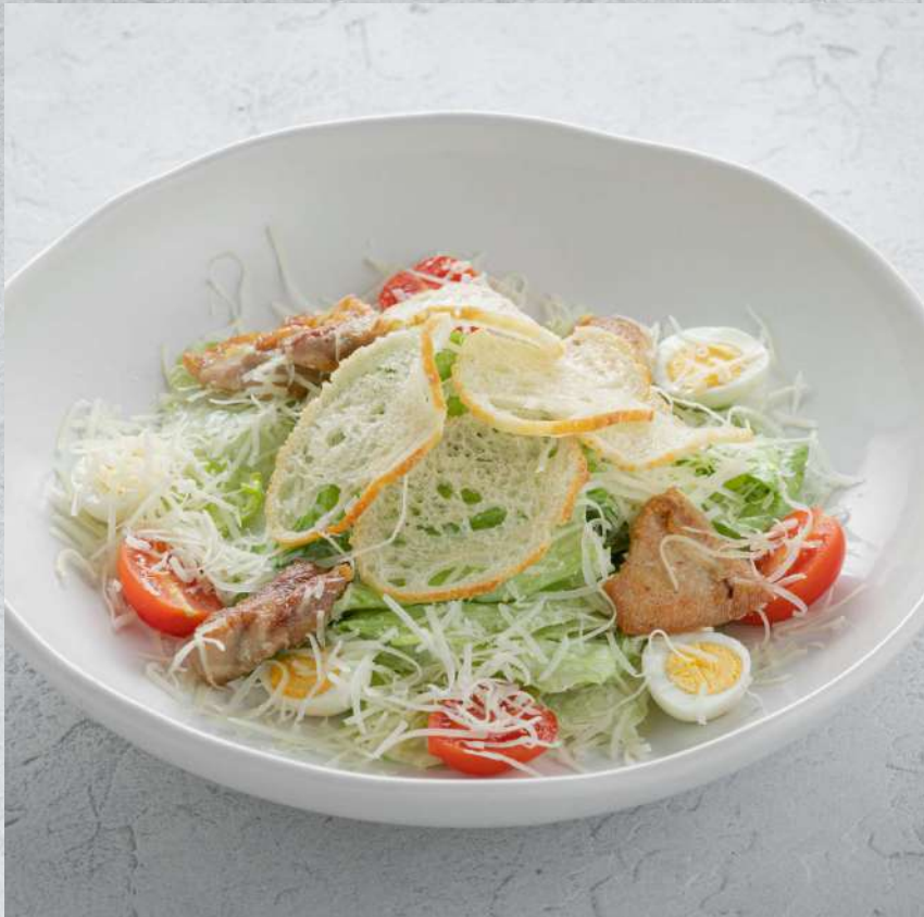
ЦЕЗАРЬ С ЦЫПЛЕНКОМ